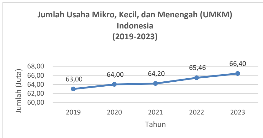
Gambar 1. Grafik Jumlah Usaha Mikro, Kecil, dan Menengah (UMKM) Indonesia (2019-2023) Sumber : KEMENKOP UKM, 2025

sekitar 96,9% dari total penyerapan tenaga kerja nasional. (KEMENKOP UKM, 2023). Perkembangan UMKM di tengah arus globalisasi dan tingginya persaingan memaksa UMKM untuk mampu menghadapi tantangan global. Keberadaan UMKM tidak diragukan lagi karena terbukti mampu bertahan dan menjadi penggerak utama perekonomian Indonesia, terutama setelah mengalami krisis ekonomi. Di sisi lain, UMKM juga kini menghadapi berbagai masalah, seperti keterbatasan modal kerja, sumber daya manusia yang kurang memadai, serta kurangnya kemampuan dalam penguasaan ilmu pengetahuan dan teknologi.