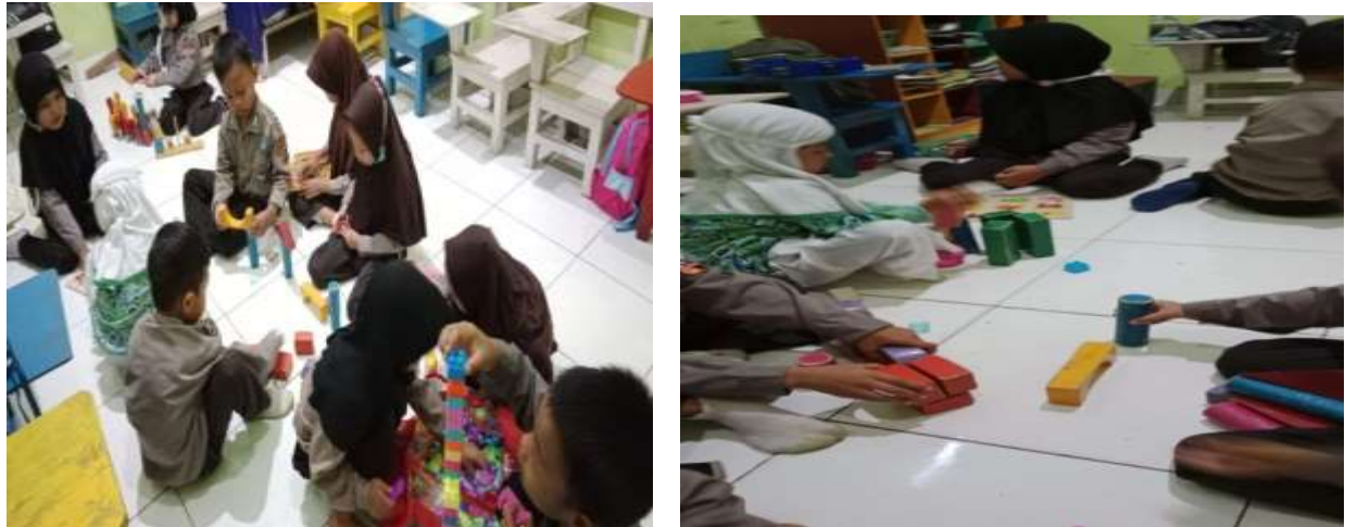
Gambar 4.2 Kegiatan Permainan Balok Montessori

ukuran dari yang paling kecil sampai paling besar. Silinder-silinder itu dilepaskan dan ditempatkan di atas meja secara acak, kemudian anak diminta untuk memasangkan kembali ke dalam lubang-lubang yang sesuai. Anak sangat antusias untuk mengamati hubungan antara ukuran lubang dan silinder. Silinder yang ukurannya lebih kecil dari lubang bisa masuk, tetapi yang lebih besar tidak bisa masuk. Anak akan mengetahui kesalahannya dan mengulang berkali-kali jika silinder yang mereka masukkan tidak tepat pada lubangnya Montessori ”.