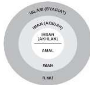
Gambar 1. Hierarki Wordview Islam

pandang seorang muslim dalam melihat suatu yang wujud. Sayyid Qutb menuliskan dalam karyanya “ Khashais At Tashawwur al Islamy wa Muqawwamatuh ”.