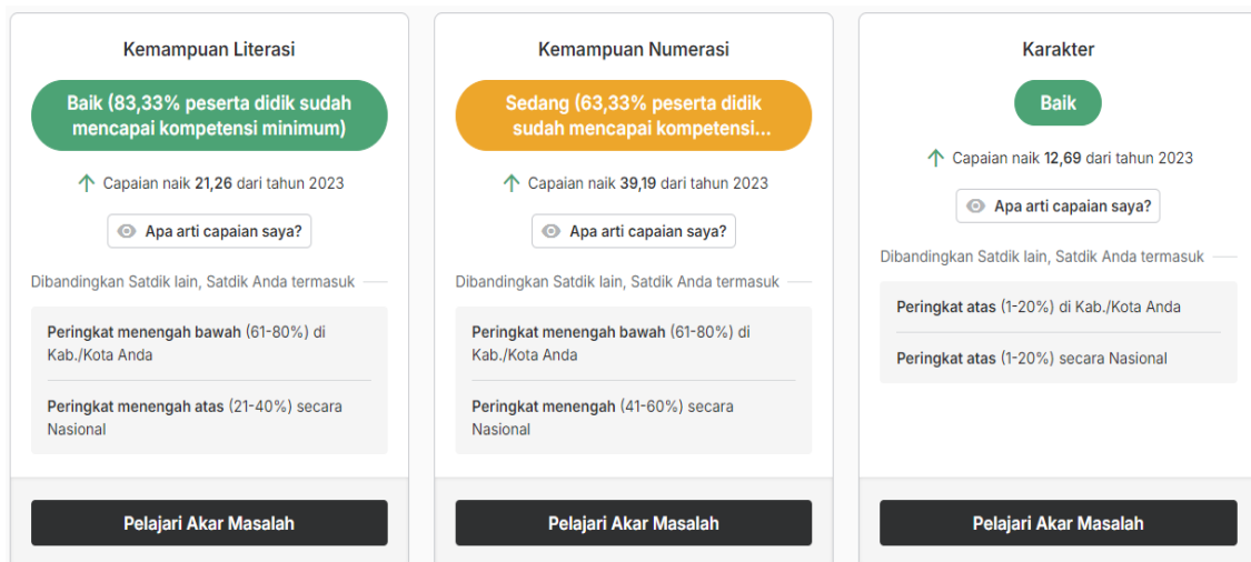
Gambar 1. Rapor Mutu Pendidikan Literasi Numerasi Karakter Tahun 2024

mana kurikulum tersebut berhasil mencapai tujuan pendidikan yang diinginkan dan apakah siswa mencapai hasil pembelajaran yang diharapkan, dampak, faktor pendukung dan kendala dalam pelaksanaan terhadap berbagai aspek. Dan evaluasi ini berfokus pada pengukuran keberhasilan, hasil konkret, dan perubahan yang terjadi sebagai akibat dari implementasi program sekolah penggerak di SDN Tamansari 03. Hasil dan dampak kegiatan program sekolah penggerak di SD Negeri Tamansari 03 dapat dirasakan baik oleh kepala sekolah, guru-guru, dan peserta didik. Dengan adanya program sekolah penggerak dapat meningkatkan kualitas SDM sekolah terutama kepala sekolah dan guru karena berhasil meningkatkan hasil belajar siswa dan rapot mutu sekolah yang tiap tahun menunjukkan peningkatan yang lebih baik dari segi penilai akademik maupun kemampuan literasi, numerasi, dan karakter. Berikut rapot mutu pendidikan SD Negeri Tamansari 03 Jakarta pada Tahun 2024.