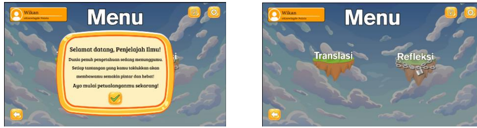
Gambar 2. Tampilan Menu Awal