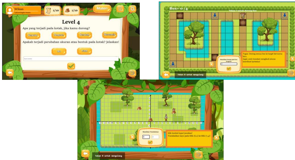
Gambar 4. Tampilan Level Game Edukasi Untuk Meningkatkan Kemampuan Pemecahan Masalah Matematika