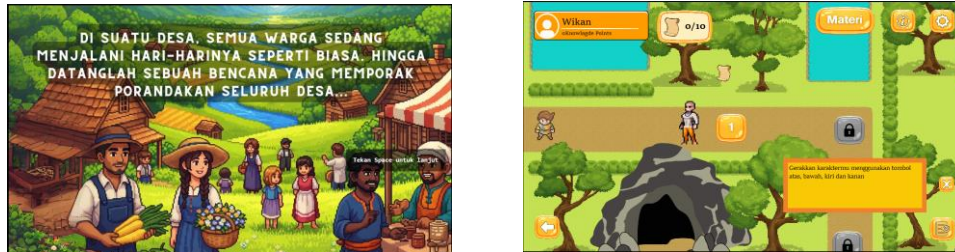
Gambar 3. Tampilan Prolog Cerita, Chapter Translasi, dan Interaksi dengan NPC