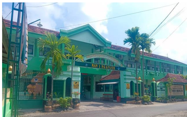
Gambar 2. MAN 1 Nganjuk

Keterikatan pada nilai religius tidak menjadi penghambat, melainkan menjadi sebuah inovasi. Teater Kompas berhasil membuktikan bahwa kedalaman emosi dalam adegan dapat tersampaikan tanpa kontak fisik diluar aturan pesantren tim artistik pun melahirkan estetika baru, seperti penggunaan atribut mahkota pada hijab yang menunjukkan bahwa menutup aurat bisa tampil memukau di atas panggung. Dengan penyeleksian naskah yang ketat untuk menjaga etika bahasa, mereka melawan stigma negative masyarakat melalui prestasi nyata. Keberhasilan meraih juara nasional hingga anggotanya yang berkontribusi di posisi strategis sekolah seperti OSIS dan MPK, menjadikan argumen bahwa teater wadah pembentukan karakter unggul bukan sekadar rekreatif. Hal ini juga membantu kendala dalam izin dan dukungan orang tua sering tidak memberikan izin atau dukungan karena menganggap kegiatan teater tidak memengaruhi nilai akademik siswa[3].