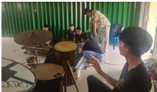
Gambar 3. Pelatihan Bidang Musik Teater Kompas

Di bidang musik, siswa berkolaborasi mengatur iringan menggunakan alat tradisional seperti saron maupun modern seperti keyboard guna menciptakan atmosfer pertunjukan yang tepat. Pada aspek manajerial, anggota dididik secara profesional mengelola keuangan, administrasi, hingga strategi pemasaran tiket yang terbukti mampu menggalang dana produksi puluhan juta rupiah. Selain itu, mereka dibekali keterampilan rancang bangun setting dengan memodifikasi fasilitas sekolah yang terbatas menjadi properti estetis serta menguasai pengaturan cahaya. Secara keseluruhan, aktivitas di Teater Kompas tidak sekadar mencetak aktor, melainkan membentuk individu yang disiplin dan memiliki kemampuan manajerial siap kerja.