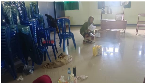
Gambar 2. Pelatihan Teater di Teater Kompas Sumber : Dokumentasi Vadyas

Kegiatan ekstrakurikuler memberikan ruang alternatif di luar kegiatan intrakurikuler yang sering kali lebih terikat pada kurikulum [18]. Dalam ruang ini, siswa mendapatkan kebebasan untuk mengekspresikan ide-ide mereka tanpa tekanan evaluasi formal. Di luar seni peran, Teater Kompas memperluas ruang eksplorasi potensi siswa agar setiap anggota dapat berkontribusi sesuai bakat uniknya. Strategi ini dikelola oleh divisi Litbang melalui pemetaan potensi sejak rekrutmen. Siswa yang berminat menjahit diarahkan menata kostum melalui riset skrip hingga eksekusi desain, seperti inovasi hijab menjadi rambut artistik dalam lakon 'Kuning' yang tetap menjaga norma agama. Siswa yang mahir menggambar didorong membuat sketsa manual hingga desain poster digital untuk kebutuhan promosi, sementara mereka yang tertarik pada tata rias dilatih mengeksplorasi rias karakter, fantasi, hingga tradisional. Hal ini melatih mereka di tuntun untuk mencari literasi mendalam dalam mengeskplor naskah yang akan dikerjakan.