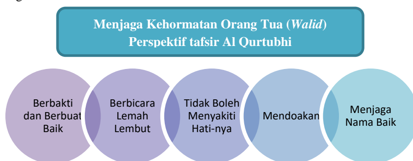
Bagan 2. Langkah Langkah Menjaga Kehormatan Orang Tua Perspektif Al Qurthubi

Terakhir, menjaga nama baik orang tua adalah bagian dari berbakti kepada mereka [49]. Anak-anak dianjurkan untuk tidak melakukan hal-hal yang dapat mencemarkan nama baik keluarga dan orang tua. Menjaga kehormatan keluarga dalam islam adalah tanggung jawab setiap individu. Menjaga nama baik orang tua mensyaratkan terpenuhinya ketiga komponen ini sekaligus: anak harus mengetahui arti kehormatan, merasakan tanggung jawab untuk menjaganya, lalu bertindak sesuai nilai tersebut [50]. Di era media sosial, pesan Al-Qurthubi ini memiliki relevansi yang sangat tinggi sebagai landasan pendidikan karakter digital generasi Muslim masa kini.