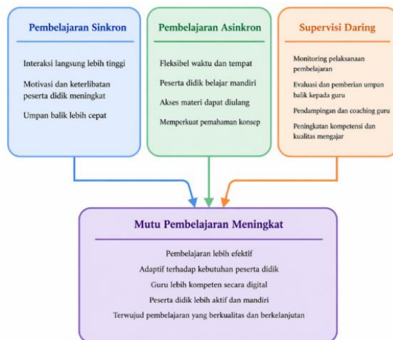
Gambar 2. Kerangka Konseptual Peningkatan Mutu Pembelajaran Digital

yang cenderung mengkaji pembelajaran sinkron, asinkron, dan supervisi daring secara terpisah. Dengan demikian, kerangka ini dapat dikategorikan sebagai model konseptual hasil pengembangan ( conceptual model development ) yang berbasis pada sintesis literatur, di mana supervisi daring diposisikan sebagai elemen penguat yang mengintegrasikan kedua pendekatan pembelajaran dalam meningkatkan mutu pembelajaran digital.