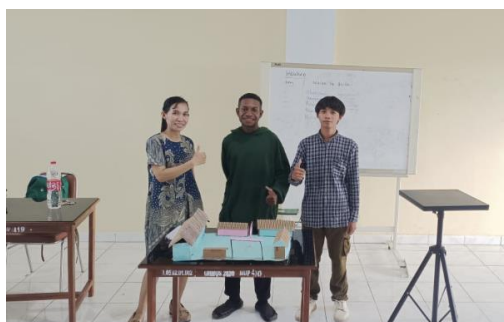
Gambar 2. Mahasiswa mempresentasikan media pembelajaran

Berdasarkan penelitian oleh Lestari dan Mahrus (2025) penting untuk mengimplementasikan pendidikan karakter dalam pembelajaran diantaranya adalah dengan mengintegrasikan nilai-nilai karakter pada mata pelajaran [4]. Selain itu, penelitian sebelumnya menunjukkan bahwa pembelajaran yang bersifat aktif dan kolaboratif dapat meningkatkan karakter dan keterlibatan mahasiswa dalam proses belajar. Penelitian yang dilakukan oleh Rahman, Yunita dkk (2024) menunjukkan bahwa pendidikan karakter yang melibatkan pembiasaan, teladan, dan dukungan dari lingkungan sekolah efektif meningkatkan disiplin dan tanggung jawab peserta didik atau siswa. Kemudian penelitian oleh Faisol, Farid menunjukkan bahwa keberhasilan aktivitas pendidik dalam mengembangkan karakter tanggung jawab siswa disebabkan oleh adanya pemahaman tentang kondisi karakter siswanya, sehingga hal ini memungkinkan adanya pengembangan karakter peserta didik [15]. Dengan demikian, strategi pembelajaran yang melibatkan berbagai aktivitas yang aktif dan kreatif dapat menjadi salah satu pendekatan yang efektif dalam meningkatkan karakter mahasiswa utamanya karakter tanggungjawab dan percaya diri. Seperti yang tersaji pada gambar 2, menunjukkan bahwa mahasiswa mampu mempresentasikan media pembelajaran yang telah dibuat didepan kelas dengan percaya diri