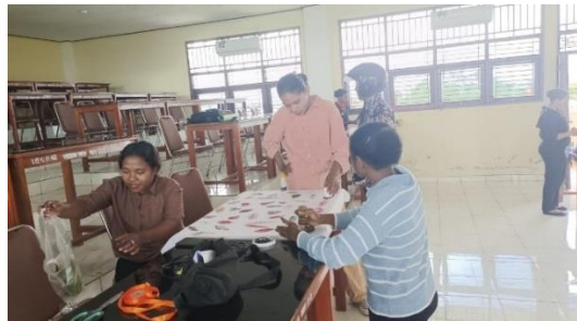
Gambar 1. Mahasiswa mengerjakan tugas membuat media pembelajaran Numerasi

Pada pembelajaran Numerasi ini, kegiatan dirancang secara aktif dan kreatif dengan tujuan untuk membuat mahasiswa mau terlibat dan bertanggungjawab serta percaya diri dalam pembelajaran Numerasi. Temuan pada penelitian ini menunjukkan bahwa pembelajaran numerasi yang dirancang secara aktif dan kreatif mampu mendorong mahasiswa untuk lebih bertanggung jawab terhadap proses belajar mereka. Selain itu, pengajar perlu memiliki strategi khusus dan bertindak taktis pada saat diperlukan terutama pada siklus ke-2 setelah siklus satu dievaluasi. Seperti yang tersaji pada gambar 1, mahasiswa terlibat secara aktif dan mengerjakan tugas membuat media pembelajaran Numerasi.