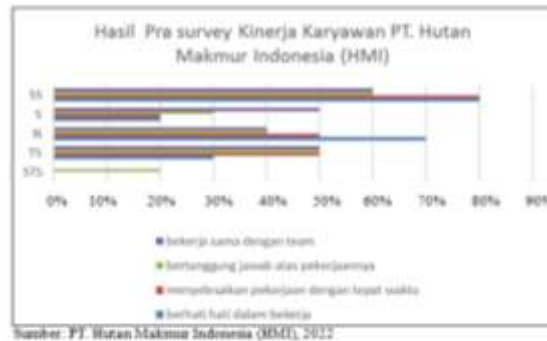
Gambar 1.1 Hasil Pra Survey 20 Karyawan PT. Hutan Makmur Indonesia (HMI)

2017). PT. Hutan Makmur Indonesia (HMI). PT. HMI merupakan perusahaan PMA yang baru didirikan pada 18 September 2018 yang bergerak di bidang usaha Industri Kayu Lapis khususnya produksi playwood. Beralamat di Kawasan Industri Terboyo dan berdiri diatas lahan seluas 10.374 m 2 . Total Karyawan yang bekerja pada PT. Hutan Makmur Indonesia (HMI) mencapai 300 orang.