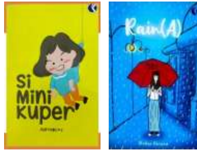
Gambar 4. Buku Novel “ Si Mini Kuper” dan Buku Novel “ Rain (A)”

Salah satu yang menerapkan keunikan konsep sebagai strategi diversifikasi adalah Novel “Si Mini Kuper”. Gaya bercerita maupun penokohan menggunakan metode yang tidak sama seperti novel kebanyakan, yaitu dengan model Nomik (Novel-Komik). Penggunaan ilustrasi yang sederhana serta cara penyajian ilustrasi yang menggantikan tulisan, juga bisa menjadi salah satu alternative dalam membuat karya produk tugas akhir dari kategori novel kedepan.