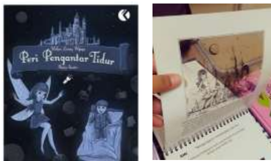
Gambar 2. Buku “Peri Pengantar Tidur”

Buku dongeng anak “Peri Pengantar Tidur” merupakan konsep buku interaktif yang melibatkan aktifitas anak secara aktif pada saat membacanya. Konsep buku ini adalah buku senter ( flashlight book ) dimana saat membaca buku anak juga dihadapkan dengan gambar imajinasi yang menceritakan jalan cerita di setiap halamannya.