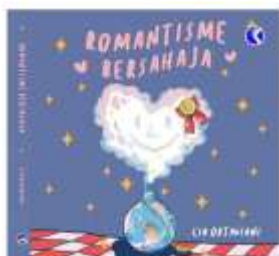
Gambar 3. Buku Puisi, Sajak dan Prosa “Romantisme Bersahaja”

Peningkatan nilai dari buku-buku puisi dapat dilakukan dari segi konten dan medium. Dari segi konten buku-buku puisi yang di produksi harus mampu memberikan daya Tarik, baik dari keunikan Bahasa maupun dari keunikan desain dan ilustrasi.