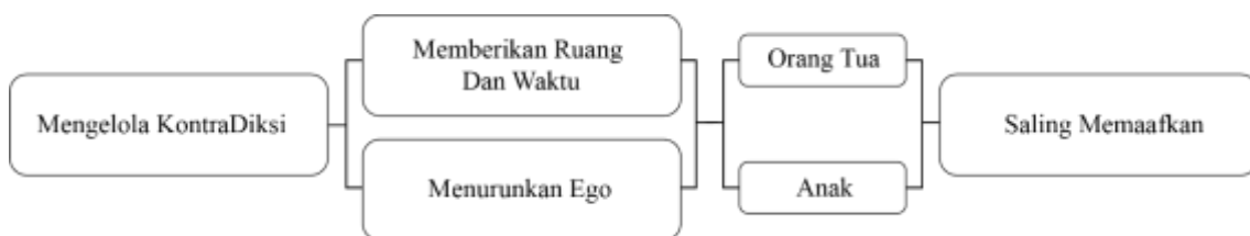
Gambar 3. Bagan Pengelolaan kontradiksi yang dilakukan orang tua dan anak

Berdasarkan hasil wawancara mengenai mengelola kontradiksi antara orang tua dan anak, diketahui bahwa dengan memberikan ruang dan waktu untuk anak, kemudian membujuk, menemui, merayu, dan saling meminta maaf menjadi hal yang sangat efektif dalam memperbaiki ketegangan yang terjadi. Karena orang tua dan anak dapat mengontrol ego dan emosi, sehingga tidak saling menyakiti serta bisa menjaga hubungan antara orang tua dengan anak lebih baik lagi. Sebab, kemampuan seseorang untuk menginterpretasikan emosi dari tindakan mereka adalah domain dari kecerdasan emosional (Setyowati, 2013). Dalam hal ini orang tua harus mampu memberikan pelajaran kepada anaknya untuk bisa menghadapi ketidakstabilan kehidupan yang melibatkan seluruh emosi, baik itu emosi negatif dan positif (Gottman & Declaire, 1998).