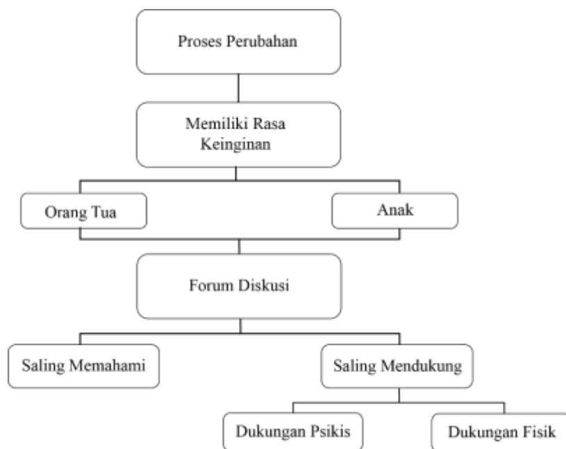
Gambar 4. Bagan Proses komunikasi yang dilakukan orang tua dan anak

Berdasarkan hasil wawancara para orang tua mengenai proses perubahan yang dilakukan dalam mengatasi kecemasan menghadapi ujian sekolah yakni dengan melakukan diskusi untuk saling memahami, mengerti, serta saling mendukung antara orang tua dan anak, sehingga proses perubahan dapat dicapai dengan baik.