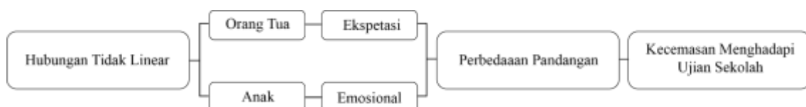
Gambar 2. Bagan hubungan tidak linear yang dialami orang tua dan anak

Berdasarkan hasil wawancara dengan para orang tua mengenai hubungan tidak linear kepada anak dalam mengatasi kecemasan menghadapi ujian sekolah, peneliti menemukan hasil bahwa dengan cara orang tua tidak banyak menuntut secara berlebihan kepada anak untuk mendapatkan nilai bagus serta harus selalu menjadi yang terbaik. Hal ini akan menekan tingkat rasa kecemasan serta stres yang berlebihan pada anak menurun, karena anak jadi tidak tertekan secara pikiran dan mental.