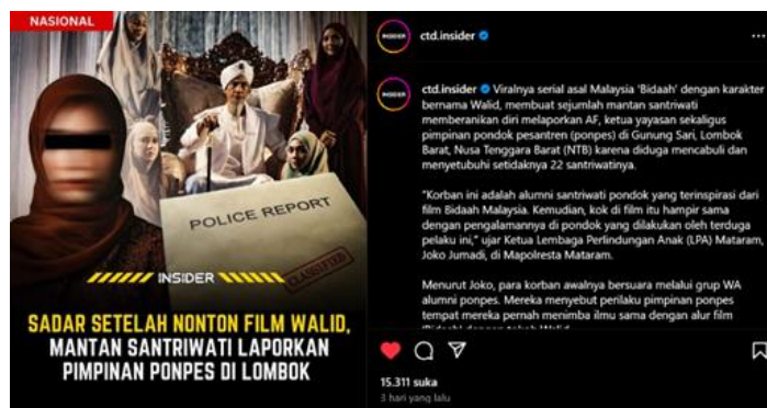
Gambar 1. Tambatan @ctd.insider pada tanggal 26 April 2025

Akun Instagram @ctd.insider yang memiliki 326 ribu pengikut, menjadi sorotan publik setelah memposting konten pada 23 April 2023 berjudul “ Sadar Setelah Nonton Film Walid, Mantan Santriwati Laporkan Pimpinan Ponpes di Lombok ”. Postingan ini dipicu oleh viralnya film asal Malaysia berjudul “ Bid’ah ” dan memicu berbagai respon publik. Berdasarkan observasi pada sampai 26 April 2025, konten tersebut memperoleh 15.311 suka, 671 komentar, dan dibagikan sebanyak 3.161 kali serta di “pin” pada feed sebagai isu nasional. Konten tersebut mengulas dugaan pelecehan seksual oleh AF, pimpinan pesantren di Gunung Sari, Lombok Barat, terhadap 22 santriwati. Para korban melapor setelah menemukan kesamaan pengalaman mereka dengan tokoh “ Walid ” dalam film “ Bid’ah ”, dan pertama kali mengungkapkan kasus tersebut melalui WhatsApp alumni. Menurut ketua LPA Mataram, Joko Jumadi, modus AF adalah menjanjikan “ keberkahan dalam rahim ” kepada korban. Saat ini, AF telah diamankan oleh pihak kepolisian dengan status sebagai terlapor karena proses penyelidikan masih berlangsung.