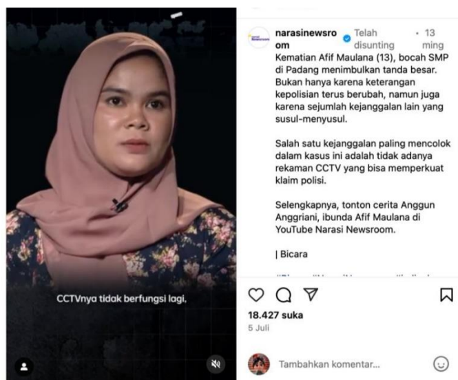
Gambar 6 . Unggahan "CCTV Tidak Berfungsi Lagi"

Framing oleh @Narasineewsroom menunjukkan keberpihakan eksplisit terhadap korban, dengan secara konsisten mengkritisi institusi kepolisian. Pernyataan seperti “Setiap tindakan kekerasan harus diusut tuntas” mengafirmasi komitmen terhadap nilai keadilan. Namun, keberpihakan tersebut menimbulkan dilema etik. Di satu sisi, framing ini sejalan dengan peran media dalam membela hak asasi manusia (Entman, 1993). Di sisi lain, framing yang menyudutkan secara sepihak dapat memperdalam polarisasi publik, sebagaimana dijelaskan oleh Iandoli et al. (2021) mengenai fenomena group polarization di media sosial. Kendati demikian, dalam konteks maraknya kejanggalan dalam kasus Afif, keberpihakan tersebut justru dapat dibaca sebagai koreksi terhadap distorsi informasi oleh media arus utama.