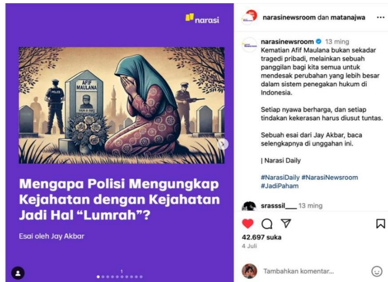
Gambar 2. Perempuan Berduka di Makam Afif

narasi tentang adanya disfungsi sistemik dan ketidakterbukaan institusi. Judul semacam ini mengisyaratkan skeptisisme terhadap informasi resmi yang dikeluarkan oleh kepolisian. Visualisasi yang menampilkan perempuan menangis di makam Afif berfungsi sebagai representasi simbolik atas penderitaan kolektif akibat kekerasan negara. Gambar ini tidak hanya merekam momen, tetapi membentuk narasi visual yang menggugah kesadaran emosional dan politik audiens (Duniya, 2025; Theisen et al., 2025).