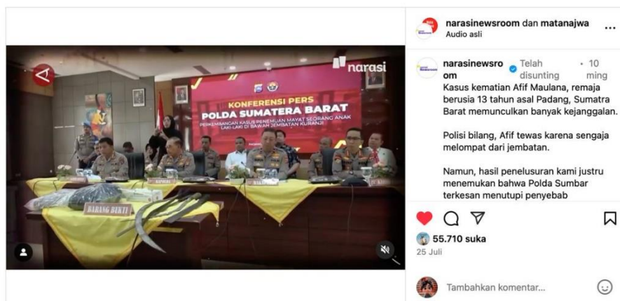
Gambar 3. Konferensi Pers Polda Sumatera Barat

Struktur skrip mengorganisasi peristiwa dalam urutan yang menuntun pembaca membentuk pemahaman kausalitas. @Narasineewsroom menyusun narasi dari kejadian kematian, pernyataan kepolisian, hingga keterlibatan Lembaga Bantuan Hukum (LBH). Alur ini menyiratkan proses sebab-akibat yang mengarah pada asumsi kesalahan aparat. Narasi tidak semata kronologis, melainkan bersifat persuasif dalam membentuk opini kritis terhadap narasi institusi. Ini sejalan dengan pemikiran Najwan dan Azmi (2023) serta Sharof-qizi dan Ruzimurodovna (2024), yang menegaskan bahwa framing tidak hanya menyampaikan informasi, tetapi juga memengaruhi konstruksi sosial atas realitas.