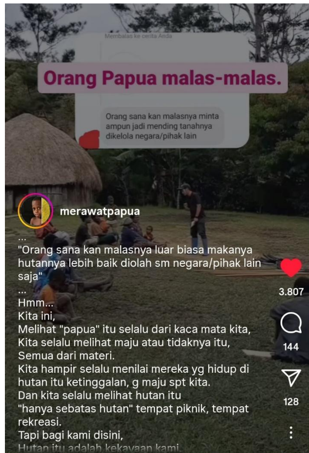
Gambar 3. Unggahan video tentang stereotip masyarakat Papua pemalas

Komentar dari komunitas virtual terkait unggahan ini di antaranya sebagai berikut: “Kalau benar masyarakatnya tidak bisa mengelola dengan baik, justru pemerintah sebagai pemegang regulasi adalah mengedukasi, mendukung, memberikan pemahaman tentang ketahanan pangan berbasis lokal yang baik. Bukan malah menebas hutan yang menjadi ibu bagi masyarakat sana”. (komentar akun @satriocandra_)