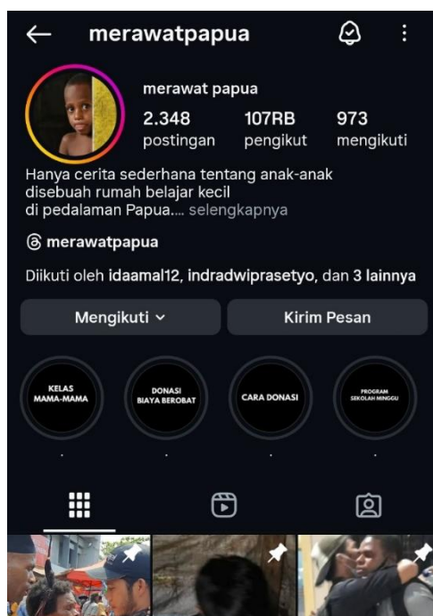
Gambar 1. Profil akun Instagram @merawatpapua

Akun Instagram @merawatpapua adalah platform yang berfokus pada kegiatan pendidikan, sosial, dan budaya di Papua. Akun ini membagikan realitas kehidupan masyarakat Papua seperti aktivitas pendidikan anak-anak, masalah kesehatan dan kemiskinan, edukasi pada masyarakat, gambaran kehidupan keluarga Papua, dan nilai budaya yang mereka anut.