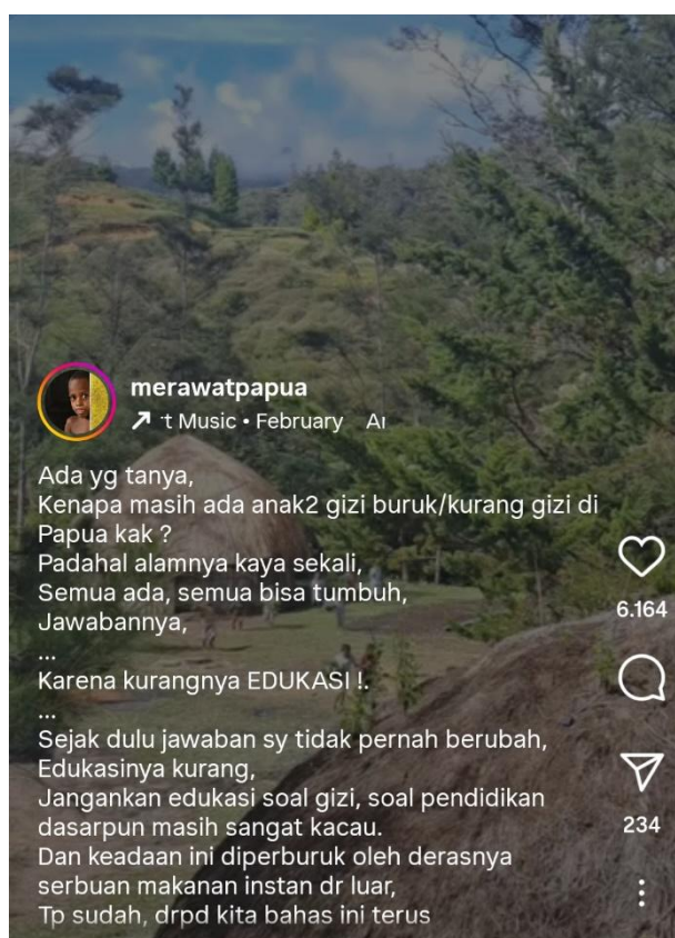
Gambar 2. Unggahan video tentang stereotip kelaparan dan kurang gizi di Papua

Unggahan 1: Stereotip bahwa masyarakat Papua mengalami kelaparan dan gizi buruk Stereotip bahwa Papua mengalami kelaparan dan gizi buruk berkembang di platform media sosial X pada Maret 2024. Asumsi tanpa sumber yang jelas muncul di kalangan warganet bahwa masyarakat Papua kekurangan bahan makanan yang memicu munculnya gizi buruk. Stereotip ini dibantah oleh akun @merawatpapua dengan mengunggah video yang memberikan penjelasan bahwa permasalahan yang terjadi di Papua adalah kurangnya edukasi tentang gizi dan kesehatan pada masyarakat. Serbuan makanan instan dari luar Papua membuat kondisi gizi masyarakat semakin memburuk, padahal tanah Papua sangat kaya akan hasil pangan untuk dikonsumsi.