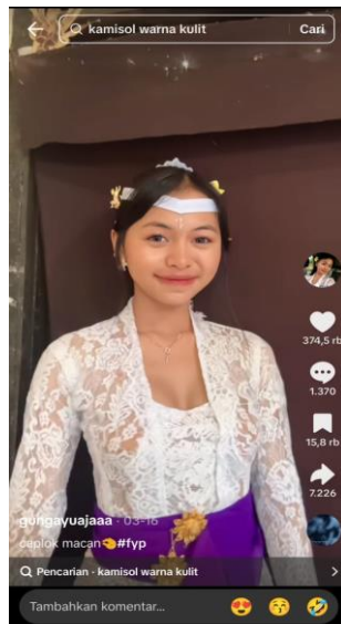
Gambar 2. Remaja mengenakan kebaya putih dengan ekspresi wajah yang berani, pose tajam dan penuh percaya diri.

Unggahan ini adalah yang paling populer di antara empat konten yang diteliti, dengan total suka mencapai 374.500 dan 1.370 komentar. Video ini memperlihatkan remaja perempuan tersebut mengenakan kebaya putih, warna yang simbolik dalam budaya Bali yang mencerminkan kesucian dan kemurnian. Namun, melalui ekspresi wajah yang ceria dan gerakan tubuh yang mengikuti irama musik, video ini menciptakan kontras yang menarik antara nilai-nilai tradisional dan gaya ekspresi modern.