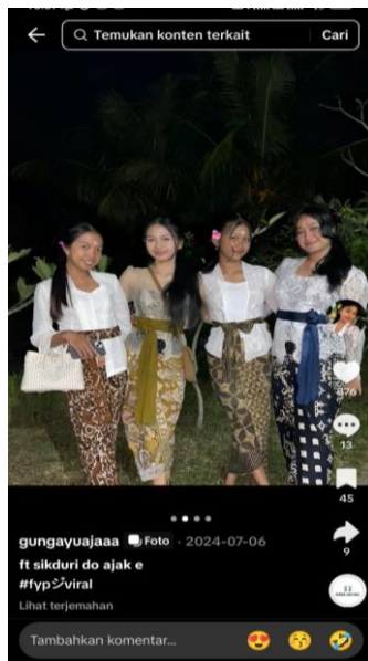
Gambar 5. Sekelompok remaja perempuan mengenakan kebaya beraneka warna dalam suasana gembira dan bersahabat.

(Putra et al., 2018) Postingan ini berbeda dari ketiga yang sebelumnya yang lebih bersifat individual. Di sini, remaja terlihat berfoto bersama teman-temannya, semuanya mengenakan kebaya dengan variasi warna dan motif yang berbeda. Suasana yang ditampilkan ceria dan penuh kebersamaan. Caption “Ft sikduri do ajak e”, menggunakan bahasa gaul Bali, berarti “Foto yang dibelakang tidak diajak”, menunjukkan kedekatan antar teman serta penerapan bahasa lokal sebagai bentuk ekspresi sosial. Meskipun hanya mendapatkan 876 suka dan 13 komentar, unggahan ini memiliki nilai kualitatif yang penting: menunjukkan bahwa pakaian tradisional tidak hanya berfungsi sebagai representasi diri secara individual, tetapi juga menjadi sarana untuk membangun solidaritas kelompok dan ekspresi bersama. Unggahan ini menekankan bahwa dalam budaya remaja Bali, pakaian tradisional juga berfungsi sebagai simbol koneksi sosial—sarana untuk menunjukkan rasa memiliki terhadap kelompok dan tradisi.