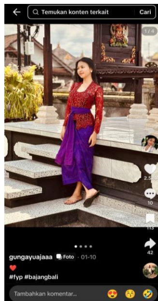
Gambar 4. Kebaya merah mencolok dengan senyuman manis, pose santai, dan latar belakang yang bersih.