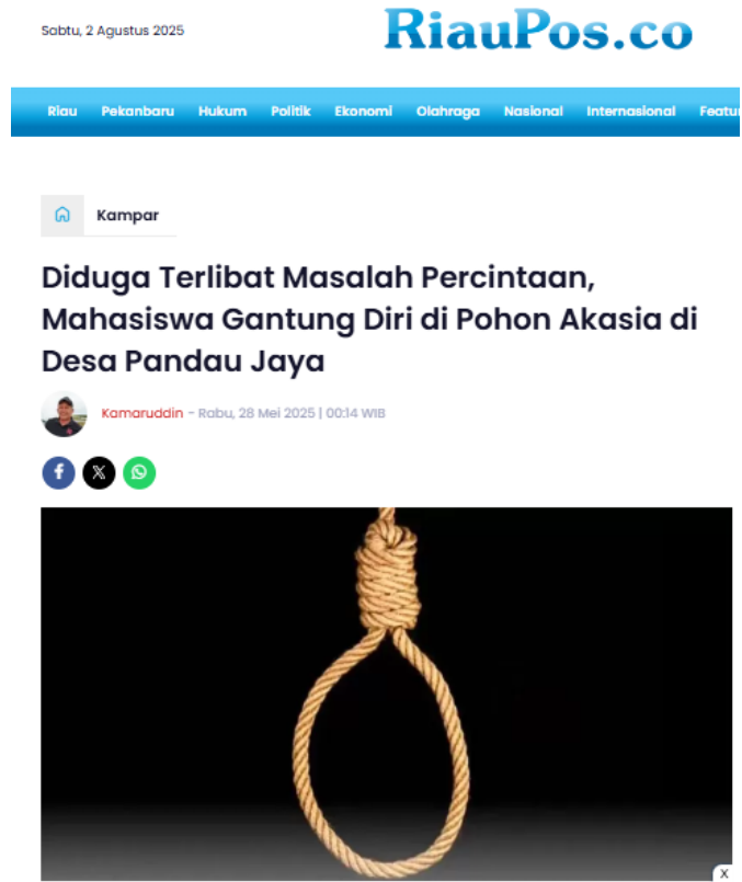
Gambar 2. Berita yang terbit di riaupos.co