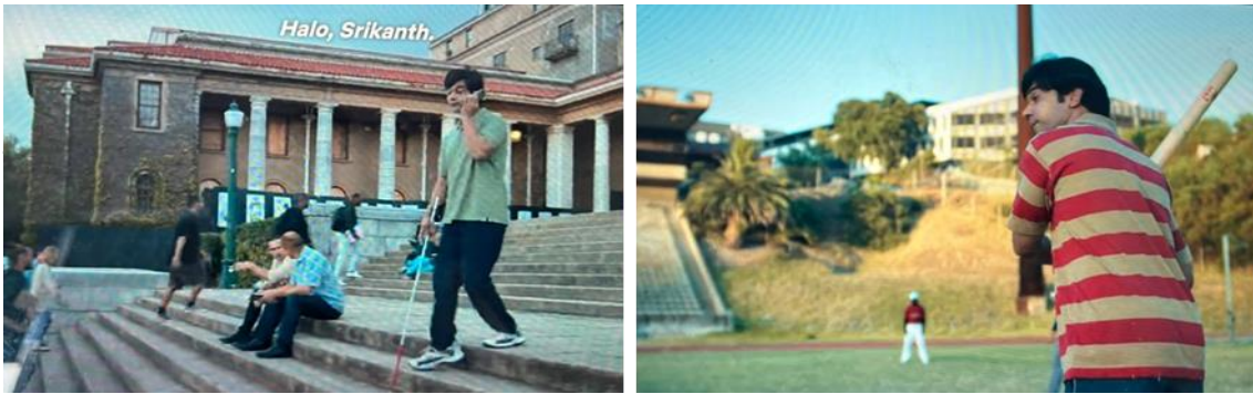
Gambar 3. Scene Srikanth melakukan aktivitas tanpa bantuan