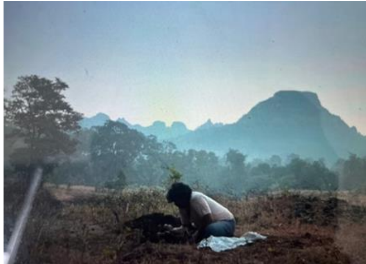
Gambar 1. Scene Srikanth hampir dikubur ayahnya

Dalam Gambar 2 diperlihatkan bahwa Srikanth bisa mengikuti kuliah di MIT dengan lancar karena institusi memberikan fasilitas tambahan bagi kelompok difabel. Misalnya penggunaan buku braille untuk tunanetra waktu di perkuliahan. Ketimpangan struktural dalam aksesibilitas di India yang menjadi penyebab orang-orang seperti Srikanth tidak bisa berkembang. Sehingga hal ini sejalan dengan temuan Meekosha (2010), yang menekankan bahwa pengalaman disabilitas itu ditentukan oleh konteks sosial dan geografis. Lingkungan yang inklusif bukan hanya memberi ruang fisik, tapi juga membentuk rasa pemberdayaan difabel.