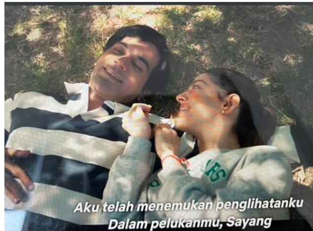
Gambar 6. Scene Srikanth menjalin hubungan romantis