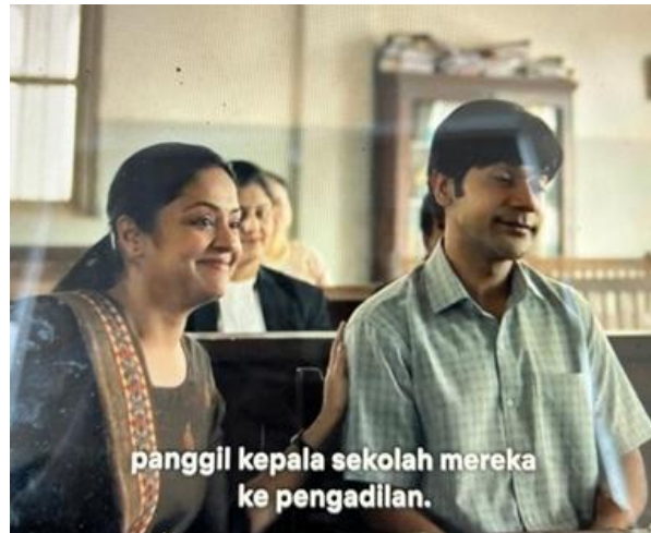
Gambar 7. Scene Srikanth menggugat diskriminasi Pendidikan India di pengadilan

melihat bahwa negara harusnya memberikan kemudahan dan kesempatan lebih luas kepada para kelompok difabel.