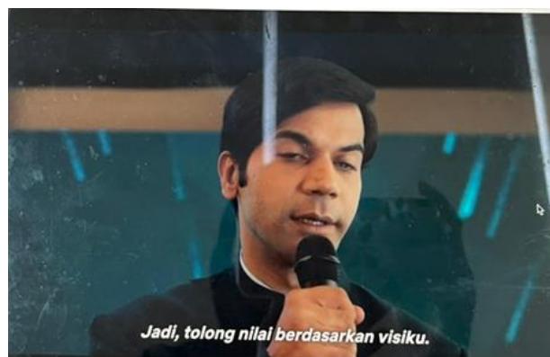
Gambar 6. Kritik Srikanth ketika menerima penghargaan kategori khusus

Adegan ketika Srikanth menolak penghargaan dalam kategori “khusus” mengandung kritik ideologis terhadap praktik ableism , yaitu pandangan yang menempatkan tubuh non-difabel sebagai standar normalitas (Campbell, 2009). Dengan menolak dilihat sebagai “individu inspiratif” hanya karena keterbatasan fisiknya, Srikanth menghadirkan counter-narrative yang menolak tokenisme. Film ini secara eksplisit menunjukkan bahwa kontribusi difabel harus diakui berdasarkan visi dan kapasitas, bukan belas kasihan atau penghargaan simbolis. Hal ini memperkaya diskusi akademik tentang representasi difabel dalam media, sekaligus mendukung pandangan Garland-Thomson (2005) bahwa politics of pity justru mengukuhkan subordinasi difabel.