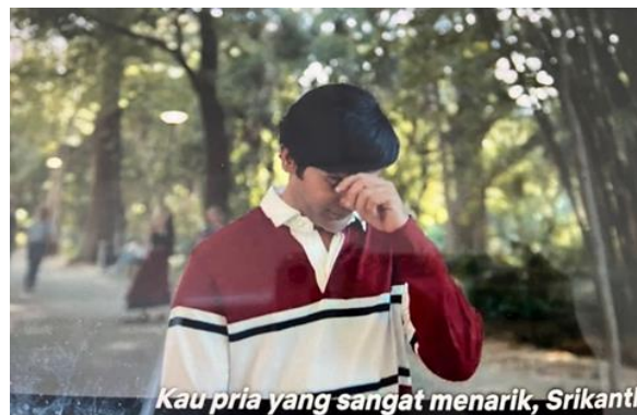
Gambar 4. Scene Srikanth sedang merapikan rambutnya dan berpakaian rapi

Dalam film Srikanth , tokoh utama digambarkan sebagai individu yang rapi, stylish , dan penuh percaya diri dalam berpakaian serta membawa diri. Ia mengenakan pakaian formal modern dan memiliki gaya rambut yang tertata rapi. Representasi ini secara visual menolak citra konvensional penyandang disabilitas yang sering diasosiasikan dengan ketergantungan, penampilan tak terawat, atau lemah secara fisik.