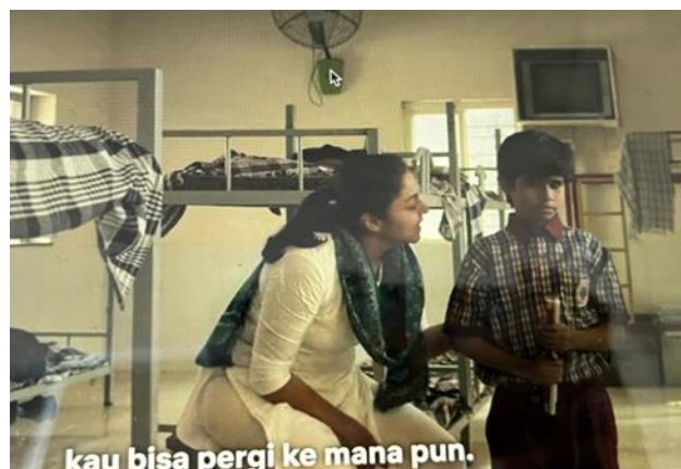
Gambar 5. Scene Srikanth mendapatkan tongkat

Temuan mengenai tongkat sebagai “sahabat” Srikanth menunjukkan pergeseran makna yang signifikan. Dalam kerangka social model of disability (Oliver, 1990), alat bantu tidak dipandang sebagai kompensasi atas “kekurangan” individu, melainkan sebagai instrumen sosial yang memungkinkan partisipasi setara. Pergeseran makna tongkat dari simbol kelemahan menjadi simbol kemandirian memperlihatkan bagaimana film Srikanth menantang medical model of disability yang menekankan keterbatasan biologis. Dengan demikian, representasi ini memperkuat teori bahwa disabilitas adalah konstruksi sosial, dan media berperan penting dalam membentuk pemaknaan ulang terhadap simbol-simbol disabilitas (Ellis & Goggin, 2015).