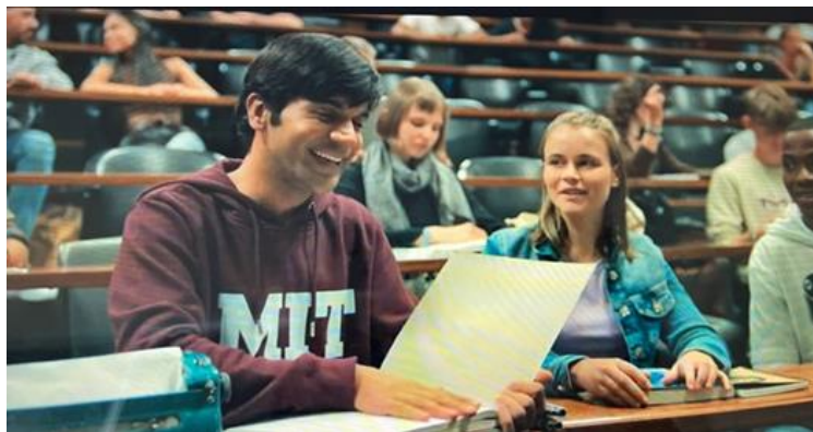
Gambar 2. Scene Srikanth kuliah di MIT

Dalam Gambar 2 diperlihatkan bahwa Srikanth bisa mengikuti kuliah di MIT dengan lancar karena institusi memberikan fasilitas tambahan bagi kelompok difabel. Misalnya penggunaan buku braille untuk tunanetra waktu di perkuliahan. Ketimpangan struktural dalam aksesibilitas di India yang menjadi penyebab orang-orang seperti Srikanth tidak bisa berkembang. Sehingga hal ini sejalan dengan temuan Meekosha (2010), yang menekankan bahwa pengalaman disabilitas itu ditentukan oleh konteks sosial dan geografis. Lingkungan yang inklusif bukan hanya memberi ruang fisik, tapi juga membentuk rasa pemberdayaan difabel.