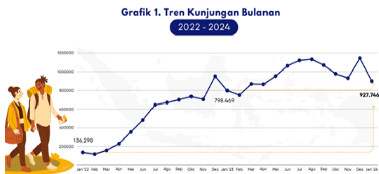
Gambar 1. Data BPS Jumlah Wisatawan di Kota Jayapura, Terakhir Diperbarui : 17 Mei 2024

Dalam hal ini, masyarakat berperan sebagai tuan rumah sekaligus pengunjung. Sebagai tuan rumah, masyarakat secara aktif berkontribusi dalam penciptaan tujuh pesona tersebut, dan sebagai pengunjung, mereka dapat mengidentifikasi peluang pariwisata dan membantu memajukan rantai pariwisata.