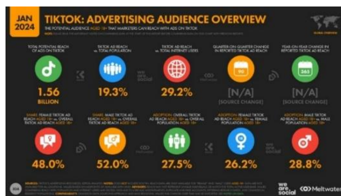
Gambar 1. Daftar Pengguna Aktif Terbanyak

TikTok semakin populer baik di Indonesia maupun di luar negeri. Banyak orang menyukai TikTok, sebuah tren dan budaya populer baru yang tidak terikat oleh kelas sosial ekonomi tertentu. Karena kemudahan akses informasi memiliki pengaruh yang signifikan terhadap budaya populer, budaya populer kini semakin terasa dampaknya di era digital (Nurhaliza, 2024). Pada tahun 2024 pengguna aplikasi TikTok tercatat mencapai 1,56 M lebih sebagai media sosial terpopuler dan pengguna aktif terbanyak ke 5 dunia pada awal tahun 2024. Jumlah ini mengalahkan aplikasi populer lainnya, hal ini menunjukkan bahwa TikTok memiliki pertumbuhan terbanyak dan memiliki banyak peminat oleh warganet dibandingkan media sosial lainnya.