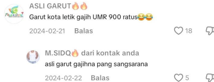
Gambar 6. Tangkapan Layar Interaksi Netizen di Akun TikTok @garupdate_

Interaksi di kolom komentar @garupdate_ sangat dinamis dan dipenuhi berbagai ekspresi, dari yang positif sampai negatif. Emosi yang sedang dirasakan, suasana di media sosial, dan arus komentar dari pengguna lain juga sangat memengaruhi. Ada kecenderungan untuk ikut-ikutan berkomentar negatif jika suasana di kolom komentar memang sedang panas atau banyak yang menyerang. Namun, interaksi tidak melulu negatif. Ada juga momen ketika netizen saling mendukung atau berdiskusi secara sehat, terutama jika konten yang dibahas bersifat membangun atau menyentuh isu yang dianggap penting.