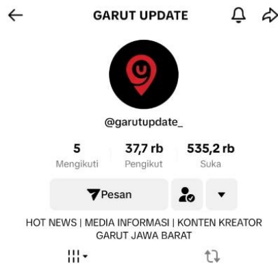
Gambar 4. Akun TikTok Garut Update

Komentar negatif merujuk pada pernyataan atau tanggapan yang bersifat menghina, merendahkan atau tidak menyenangkan kepada pengguna atau konten yang mereka unggah. Ujaran kebencian ( hate speech ) merujuk pada pernyataan yang mengandung kebencian, provokasi atau menyerang terhadap individu atau kelompok berdasarkan suku, agama, ras dan gender. Penyebaran informasi hoax merupakan perundungan yang memanfaatkan informasi palsu, menyerang yang dapat mencemarkan nama baik dan merusak reputasi seseorang atau kelompok. Penggunaan meme negatif penggunaan gambar atau video yang telah diubah bertujuan untuk menghina dan mengejek untuk mempermalukan seseorang. Peneliti tertarik dan menjadikan objek akun media sosial TikTok @garutupdate_ sebagai bahan peneliti untuk mengkaji dan mengetahui bentuk komentar-komentar netizen yang mengarahkan kepada cyberbullying .