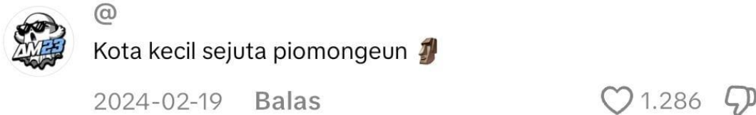
Gambar 5. Penggunaan Emoji Pada Komentar TikTok @garupdate_

Budaya di akun TikTok @garupdate_ terbentuk dari kebiasaan komunikasi netizen di kolom komentar, banyak dipengaruhi oleh lokalitas Garut dan Sunda. Istilah daerah seperti “pucek”, “bgst”, “kieu pisan”, atau “gaskeun” memperkuat identitas lokal sekaligus menciptakan nuansa unik. Selain itu, penggunaan emoji seperti marah, jari tengah, badut, dan ular juga menjadi cara menegaskan emosi negatif, sindiran, atau ejekan.