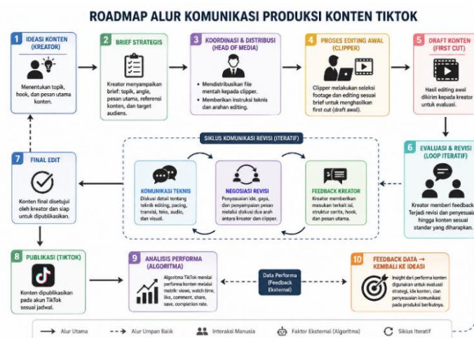
Gambar 1. Roadmap Alur Komunikasi dan Alur Pembuatan Konten Dari Kreator Sampai Clipper

Pola terakhir berkaitan dengan komunikasi pemeliharaan hubungan kerja. Temuan penelitian menunjukkan bahwa komunikasi interpersonal yang positif antara kreator dan clipper mempengaruhi suasana kerja dan mempercepat proses revisi. Sikap saling menghargai waktu, apresiasi, dan kejelasan ekspektasi menjadi faktor yang memperkuat hubungan profesional.