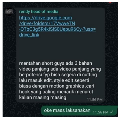
Gambar 2. Penyaluran Konten Panjang Yang Telah Diproduksi Oleh Kreator Kepada Para Clipper