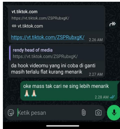
Gambar 4. Revisi Konten Dari Head Of Media Untuk Clipper

Pola komunikasi semacam ini menunjukkan pemanfaatan media digital sebagai sarana komunikasi tugas ( komunikasi berorientasi tugas ), yang sesuai dengan karakter kerja kreatif berbasis platform yang menuntut kecepatan dan presisi. Dalam teori kekayaan media , pesan yang bersifat teknis dan kontekstual dapat disampaikan secara efektif melalui media digital selama terdapat kesepahaman bersama di antara anggota tim (Dennis, Fuller, & Valacich, 2008)