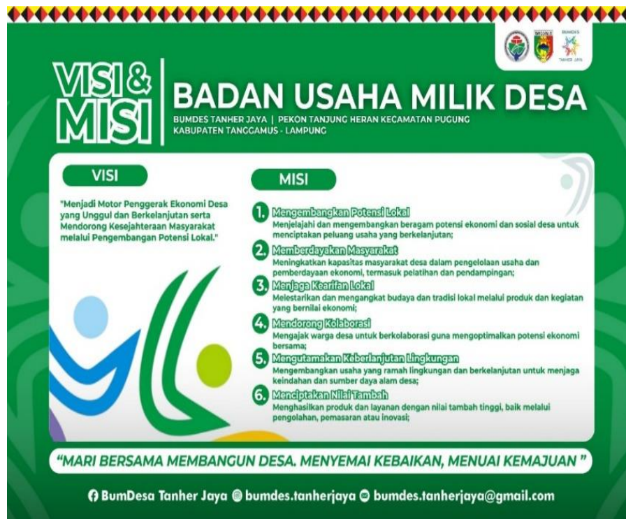
Gambar 2. Visi dan Misi Badan Usaha Milik Desa Pekon Tanjung Heran

Gambar diatas adalah media sosial yang digunakan oleh pengurus BUMDes Pekon Tanjung Heran dalam melakukan penyaluran informasi sebagai salah satu bentuk komunikasi untuk warga masyarakat Pekon Tanjung Heran maupun masyarakat umum. Instagram ini sebagai salah satu bentuk media informasi yang mudah diakses bagi masyarakat. Beberapa informasi yang telah dipublish diantaranya sosialisasi program, struktur pengurus, visi dan misi BUMDes Pekon Tanjung Heran, company profile maupun dokumentasi finalisasi program yang telah berjalan.