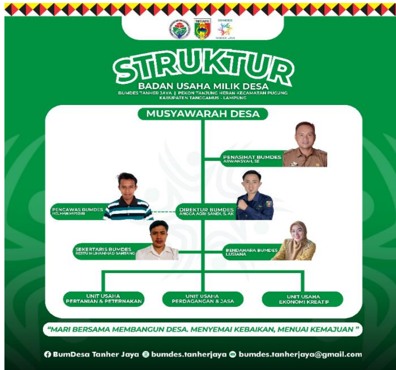
Gambar 3. Struktur Pengurus BUMDes Pekon Tanjung Heran

Kedua gambar tersebut telah terupload dan terdokumentasikan di media sosial milik BUMDes Pekon Tanjung Heran, sehingga dapat diakses oleh masyarakat umum maupun masyarakat Desa Pekon Tanjung Heran sendiri. Sehingga media sosial berupa Instagram sangat dimanfaatkan dengan baik oleh pengurus untuk menyampaikan informasi dan sebagai media komunikasi kepada masyarakat dan dinilai efektif dalam meningkatkan partisipasi masyarakat. Sejalan dengan hal tersebut, Direktur BUMDes Pekon Tanjung Heran juga sempat menyinggung bahwa media Instagram mereka cukup informatif untuk melihat kegiatan yang dilakukan oleh BUMDes Pekon Tanjung Heran.