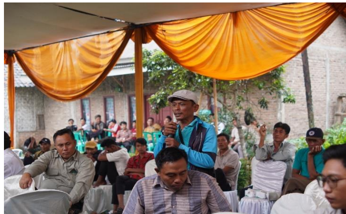
Gambar 5. Masyarakat Yang Bertanya Saat Sosialisasi Program Ketahanan Pangan

Dalam gambar ini terlihat semua lapisan masyarakat dapat hadir dalam salah satu program BUMDes Pekon Tanjung Heran melalui sosialisasi langsung. Pada sosialisasi ini masyarakat mendapatkan informasi langsung dari pengurus BUMDes Pekon Tanjung Heran dan dapat bertanya jawab terkait program yang akan dilaksanakan. Sosialisasi ini tidak hanya menysasar satu atau dua lapisan masyarakat, namun dapat diakses oleh semua lapisan masyarakat dan kalangan. Sehingga informasi yang didapat lebih aktual dan dapat diterima langsung oleh masyarakat setempat.