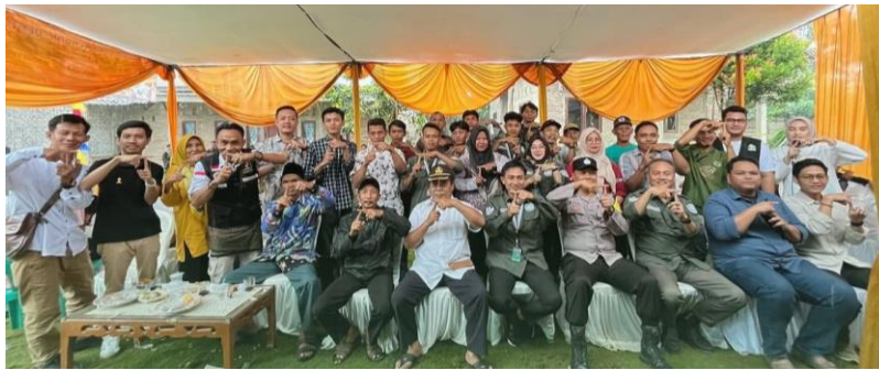
Gambar 4. Sosialisasi Program Ketahanan Pangan

dalam berbagai kalangan di Desa Pekon Tanjung Heran karena tidak terbatas usia dapat mengikuti kegiatan ini dan informasi yang disampaikan dapat langsung diterima dan tepat sasaran.