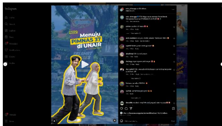
Gambar 2. Konten kolaborasi pov MENUJU PIMNAS 37 di UNAIR

Pengaplikasian konten kolaborasi dalam media sosial instagram memberikan peluang yang sangat positif dan juga dapat meningkatkan branding antar lembaga dalam melakukan kegiatan. Selama bulan oktober 2024-januari 2025 Kemendikdisaintek.ri mengunggah 30 postingan kolaborasi diantaranya kolaborasi Kemendikdisaintek.ri x @kamivokasi x @kemendikdasmen, Kemendikdisaintek.ri x @kamivokasi x @kelembagaanvokasi x @cerdasberkarakter,Kemendikdisaintek.ri x @univ_airlangga x @pimnas37.unair x @official.alumnipimnas, Kemendikdisaintek.ri x @cerdasberkarakter.kemdikbudri x @ditjen.gtk.kemdikbud x @direktoratsmk x @puspresnas x @kemendikdasmen. Tentunya kemndiktisaintek berkolaborasi dengan lembaga-lembaga yang berkaitan dengan pendidikan di indonesia seperti universitas dan pendidikan lembaga lainnya. Kolaborasi sebagai suatu upaya untuk merencanakan, melaksanakan dan mengevaluasi suatu program yang didalamnya terdapat tindakan bersama yang dilakukan pihak yang terlibat untuk mencapai tujuan tim tersebut.