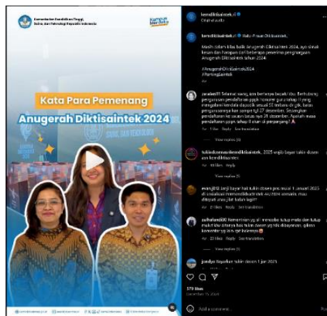
Gambar 1. Konten hiburan Kata Para Pemenag Anugrah Diktisaintek 2024

Salah satu jenis konten hiburan yang menarik perhatian besar dari para pengikut Instagram adalah konten ”Kata Para Pemenag Anugrah Diktisaintek 2024”