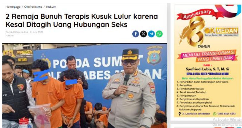
Gambar 1: Berita di rubrik Okeperistiwa

Dalam konteks media siber lokal, kompleksitas tersebut semakin terlihat pada rubrik pemberitaan yang memuat isu-isu sensitif, seperti hukum dan peristiwa kriminal. Untuk memperkuat analisis terkait dinamika gatekeeping dan keberimbangan informasi, berikut disajikan contoh berita awal yang dipublikasikan oleh Okemedan.com sebagai bagian dari proses pemberitaan dalam rubrik OkePeristiwa: