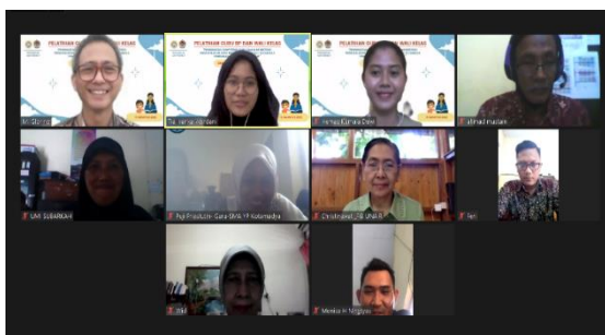
Gambar 1. Pelatihan Pembelajaran Terapeutik bersama Guru Wali Kelas dan BP di SMA Kotamadya Blitar

Pada kegiatan pelatihan mengidentifikasi kesulitan belajar siswa dilakukan oleh para guru dari SMA YP Kotamadya Blitar pada tanggal 27 Mei 2021 oleh tim pelaksana Pengabdian Kepada Masyarakat dari Fakultas Ilmu Budaya, Universitas Airlangga yang beranggotakan 2 (dua) orang. Kegiatan pelatihan dilaksanakan secara daring, yaitu menggunakan aplikasi Zoom dikarenakan kondisi pandemi Covid-19 yang belum memungkinkan untuk pelaksanaan secara tatap muka (Gambar 1).