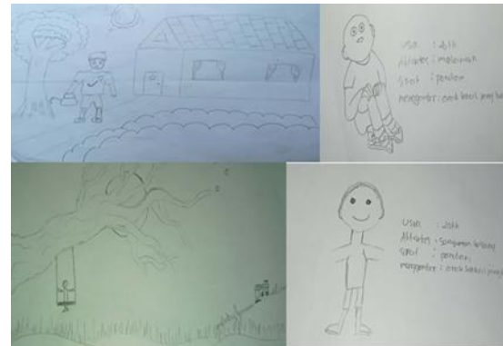
Gambar 2. Hasil karya Peserta Didik yang dievaluasi

serius. Kondisi rumah pada tataran normal, hal ini ditunjukkan dengan gambar rumah dan pepohonan yang berwarna cerah. Tetapi ketika didiagnosis dari hasil gambar orang yang digambarkan, maka teridentifikasi hubungan antara peserta didik dan orang lain yang dia gambarkan mengidentifikasi adanya masalah yang belum terselesaikan (Gambar 2). Cerita yang ditulis peserta didik ini juga tentang seorang pria yang marah karena didegang oleh kekasihnya, dan hal ini menunjukkan bahwa peserta didik tersebut masih menyimpan dendam terhadap pria tersebut.