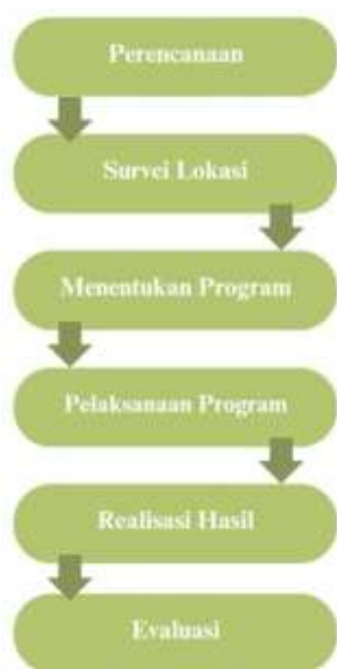
Gambar 1 Struktur Pelaksanaan Kegiatan

Adapun pelaksanaan program kerja, diantaranya: