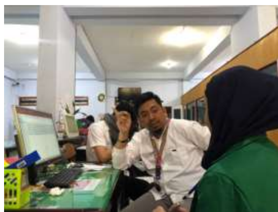
Gambar 2. Koordinasi Mahasiswa dengan petugas Bidang Penyelenggaraan Pelayanan Perizinan dan Non Perizinan DPMPTSP dalam rangka persiapan pelaksanaan Pendampingan.

Kegiatan ini dilaksanakan pada tanggal 23 Januari 2023 bertempat di kantor Dinas Penanaman Modal dan Pelayanan Terpadu Satu Pintu Kabupaten Banggai. Kegiatan ini dilakukan bertujuan untuk mendapatkan informasi kapan akan dilaksanakan kegiatan pendampingan tersebut serta menentukan siapa saja yang akan dilibatkan dalam kegiatan tersebut serta muatan apa saja yang perlu didampingi dalam rangka pelaksanaan prosedur teknis pendaftaran perizinan dan berusaha melalui website OSS.