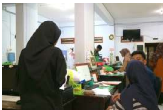
Gambar 1. Observasi dengan petugas Bidang Penyelenggaraan Pelayanan Perizinan dan Non Perizinan Dinas Penanaman Modal dan Pelayanan Terpadu Satu Pintu Kabupaten Banggai.

Implementasi Pelayanan Perizinan Berusaha Terintegrasi Secara Elektronik Online Single Submission (OSS) Pada Dinas Penanaman Modal dan Pelayanan Terpadu Satu Pintu Kabupaten Banggai selama ini.