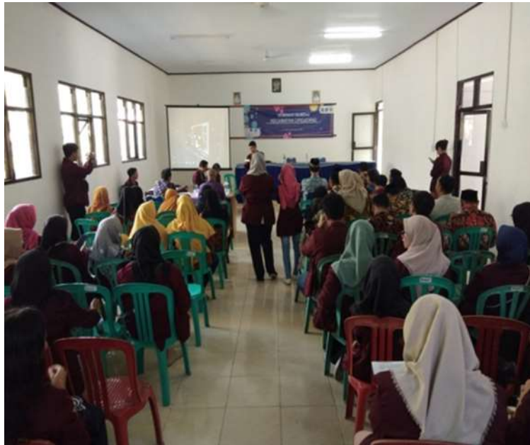
Gambar 2 Panitia dan Pemateri Sosialisasi Badan Usaha Milik Desa