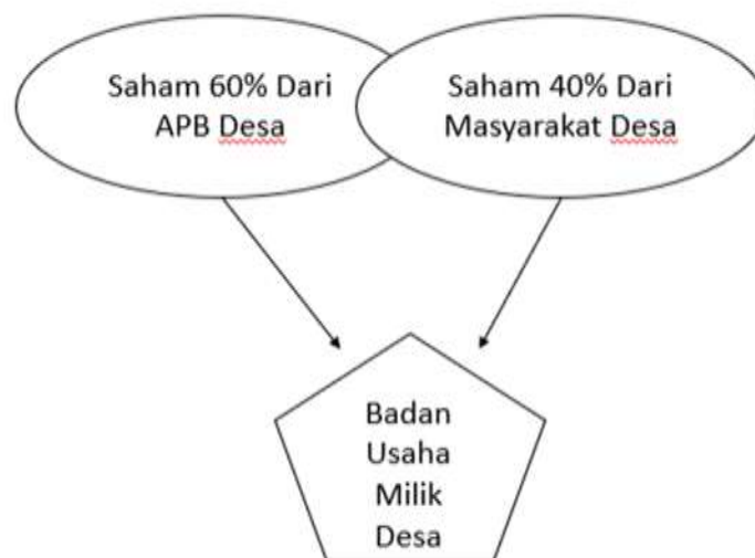
Gambar 3 Skema Permodalan Badan Usaha Milik Desa

Namun demikian, dalam konteks inilah menjadi yang ihwal sangat penting karena proses pendirian dan pengembangan BUM Desa menjadi momentum untuk mencari kerangka organisasi yang tepat dan layak bagi ekonomi desa. Untuk mendorong partisipasi masyarakat kepemilikan BUM Desa tidak hanya dimiliki oleh perangkat desa tetapi juga dimiliki oleh Masyarakat desa setempat.