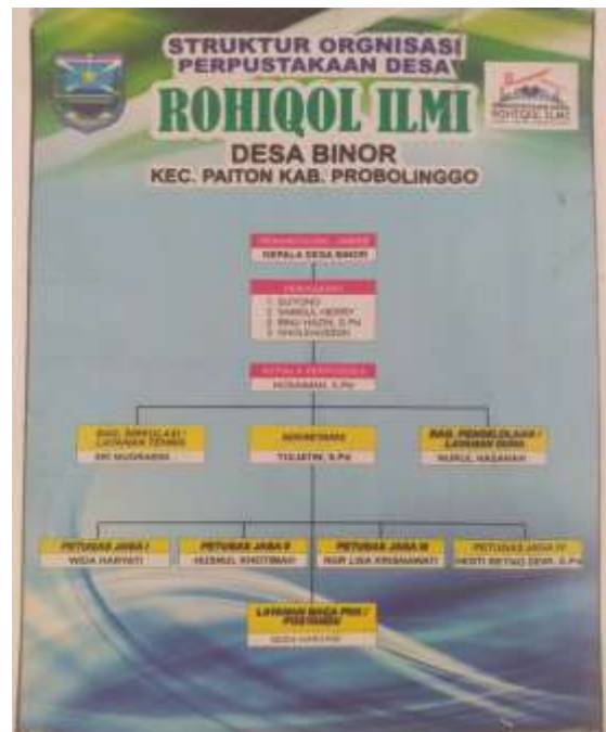
Gambar 1. Struktur Kepengurusan Perpustakaan Desa Binor, Paiton, Probolinggo, Jawa Timur

Berdasarkan data struktur pengurus perpustakaan Binor, belum ada petugas yang sesuai dengan sarjana perpustakaan, yang ada adalah sarjana pendidikan dan sedang menempuh proses sarjana, bahkan ada yang belum sarjana (Hidayah & Hidayah, 2022).