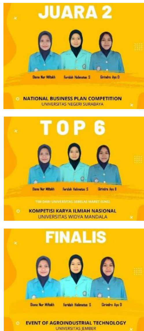
Gambar 4. Capaian Prestasi Tim Binaan Universitas Sebelas Maret (UNS)

Dari keempat event tersebut, tim binaan dari Universitas Sebelas Maret (UNS) berhasil meraih tiga prestasi yaitu Juara 2 National Business Plan Competition (NBPC) 2021, Top 6 National Food Technology Competition (NFTC) 2021, dan Finalis ENOTECH ( Event Of Agroindustrial Technology ) 2021. Dokumentasi apresiasi prestasi mereka dapat dilihat pada gambar berikut: