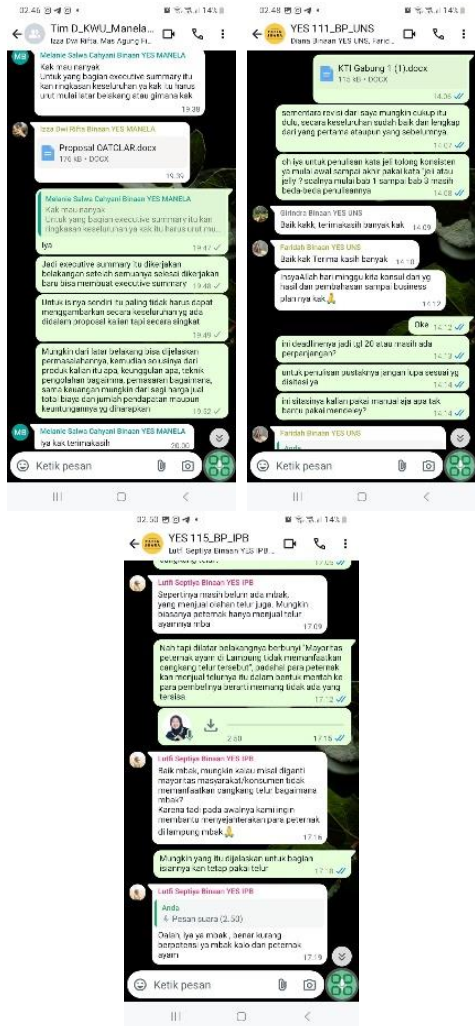
Gambar 1. Proses Pendampingan Penulisan Proposal Kewirausahaan atau Business Plan melalui Grup WhatsApp