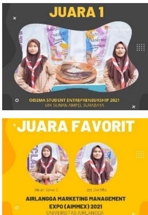
Gambar 3. Capaian Prestasi Tim Binaan MAN 1 Lamongan

Dari ketiga event tersebut, tim binaan dari MAN 1 Lamongan berhasil meraih dua prestasi yaitu Juara 1 Student Entrepreneurship dalam rangkaian acara Olympiad of Islamic Educational Management (OISEMA) 2021 dan Juara Favorit National Studentpreneur Competition (NSC) dalam rangkaian acara Airlangga Marketing Expo (AIMMEX) 2021. Dokumentasi apresiasi prestasi mereka dapat dilihat pada gambar berikut: