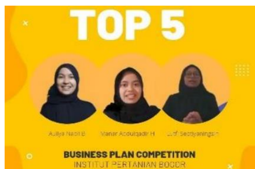
Gambar 5. Capaian Prestasi Tim Binaan Institut Pertanian Bogor (IPB)

Manfaat dan keuntungan yang diperoleh dari kegiatan pengabdian masyarakat berupa pendampingan penulisan karya tulis kewirausahaan ini sangat signifikan bagi para peserta. Salah satu manfaat utamanya adalah peningkatan kemampuan penulisan proposal kewirausahaan atau business plan . Dengan bimbingan dari mentor yang berpengalaman dan berprestasi di bidang kewirausahaan, peserta dapat belajar dari pengetahuan dan pengalaman mentor yang luas. Ini membantu peserta memahami secara mendalam