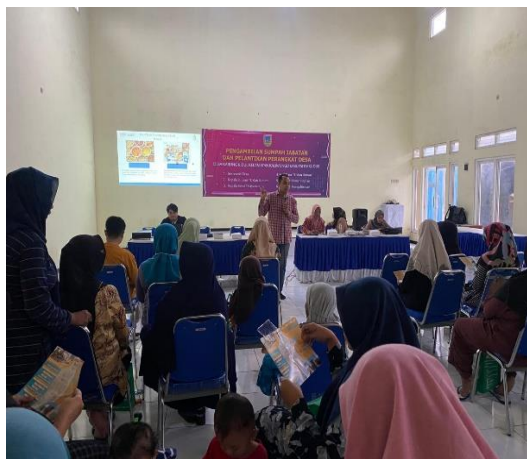
Gambar 2. Kegiatan Sosialisasi

Proses pelaksanaan kegiatan pengabdian kepada masyarakat terlaksana pada hari Sabtu 8 Maret 2024 yang berlokasi Balai Kelurahan Gemiring Kidul, Kecamatan Kaliwungu, Kabupaten Kudus. Tim pengabdian memaparkan materi tentang pengelolaan manajemen logistik rumah tangga terhadap produk perishable dan non perishable