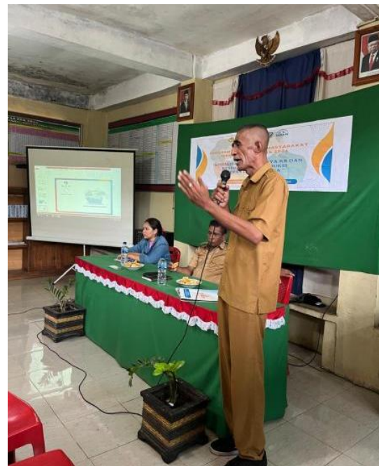
Gambar 1. Pemateri Penyuluhan

Kegiatan ini dilaksanakan dengan melibatkan peran serta Badan Penyuluhan KB Kecamatan Witihama yang diundang sebagai pemateri dalam sosialisasi tersebut. Sosialisasi dalam pengabdian kepada masyarakat ini dilakukan dengan metode ceramah dan diskusi untuk menjelaskan ide, pengertian secara lisan dan juga sesi tanya jawab sehingga para pasangan usia subur dalam hal ini sebagai sasaran kegiatan sosialisasi dapat memahami apa yang diberikan dan disampaikan. Selain itu materi yang diberikan ditampilkan melalui power point yang ditampilkan menggunakan proyektor yang berisi informasi tentang KB dan kesehatan reproduksi disertai gambar-gambar menarik sehingga pasangan usia subur lebih mudah memahami serta menangkap informasi yang diberikan. Selama kegiatan sosialisasi berlangsung nampak para pasangan usia subur serta kader-kader posyandu sangat antusias mendengarkan dan memberikan respons yang baik selama diskusi berlangsung, dengan aktif menjawab pertanyaan-pertanyaan narasumber juga turut serta mengutarakan kerisauan atau kebingungan mereka yang berkaitan dengan materi penyuluhan hari itu.