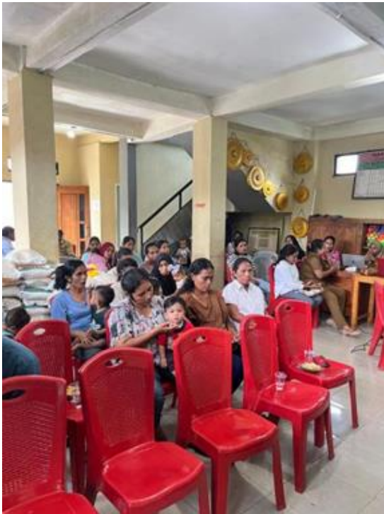
Gambar 2. Peserta Kegiatan Penyuluhan

Pemateri juga memberikan pengetahuan mengenai tanda-tanda persalinan, seperti pecahnya ketuban dan pembukaan jalan lahir, yang penting untuk diketahui oleh calon ibu dan pasangannya. Informasi ini sangat krusial bagi pasangan baru yang subur agar mereka dapat segera mendapatkan pertolongan medis di fasilitas kesehatan atau dari bidan setempat ketika tanda-tanda persalinan muncul. Selain itu, pengetahuan ini juga penting dalam pelaksanaan program KB, karena dengan memahami proses persalinan, pasangan dapat merencanakan kelahiran anak dengan lebih baik dan memastikan keselamatan ibu dan bayi yang akan dilahirkan.