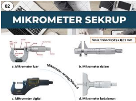
Gambar 2. Materi pengenalan alat ukur yang disampaikan oleh tim pengabdian kepada masyarakat

Tim PKM selanjutnya meminta para siswa untuk membentuk kelompok dan tim PKM membagikan lembar kerja praktikum kepada masing-masing kelompok. Selanjutnya, tim PKM memberikan arahan terkait pelaksanaan kegiatan praktikum pengukuran menggunakan alat ukur yang sudah disiapkan. Masing-masing kelompok melakukan pengambilan data pengukuran sesuai dengan langkah-langkah kerja yang tersedia di lembar kerja praktikum. Selama kegiatan praktikum berlangsung, tim PKM berperan sebagai fasilitator masing-masing kelompok untuk memastikan para siswa dapat menggunakan alat ukur dengan benar dan tepat. Proses kegiatan praktikum yang dilakukan oleh siswa kelas X MIA 2 SMA Negeri 27 Maluku Tengah ditampilkan pada Gambar 3.