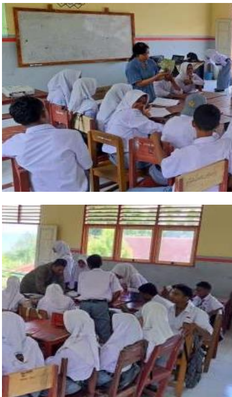
Gambar 3. Pelaksanaan kegiatan praktikum oleh siswa kelas X MIA 2 SMA Negeri 27 Maluku Tengah.

Tim PKM selanjutnya meminta para siswa untuk membentuk kelompok dan tim PKM membagikan lembar kerja praktikum kepada masing-masing kelompok. Selanjutnya, tim PKM memberikan arahan terkait pelaksanaan kegiatan praktikum pengukuran menggunakan alat ukur yang sudah disiapkan. Masing-masing kelompok melakukan pengambilan data pengukuran sesuai dengan langkah-langkah kerja yang tersedia di lembar kerja praktikum. Selama kegiatan praktikum berlangsung, tim PKM berperan sebagai fasilitator masing-masing kelompok untuk memastikan para siswa dapat menggunakan alat ukur dengan benar dan tepat. Proses kegiatan praktikum yang dilakukan oleh siswa kelas X MIA 2 SMA Negeri 27 Maluku Tengah ditampilkan pada Gambar 3.