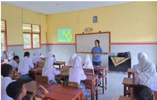
Gambar 1. Proses penyampaian materi alat ukur oleh tim pengabdian kepada masyarakat

Kegiatan pengabdian kepada masyarakat (PKM) di SMA Negeri 27 Maluku Tengah berfokus pada pemberian materi dan praktikum menggunakan alat ukur. Pelaksanaan kegiatan PKM dilakukan pada hari Senin, 04 September 2024 pada pukul 09.00 WIT sampai dengan 11.00 WIT. Peserta PKM ini adalah siswa kelas X MIA 2 dengan jumlah peserta didik sebanyak 21 siswa. Judul materi yang disampaikan kepada siswa kelas X MIA 2 adalah Edukasi Peralatan Pengukuran. Proses penyampaian materi ditampilkan pada Gambar 1.