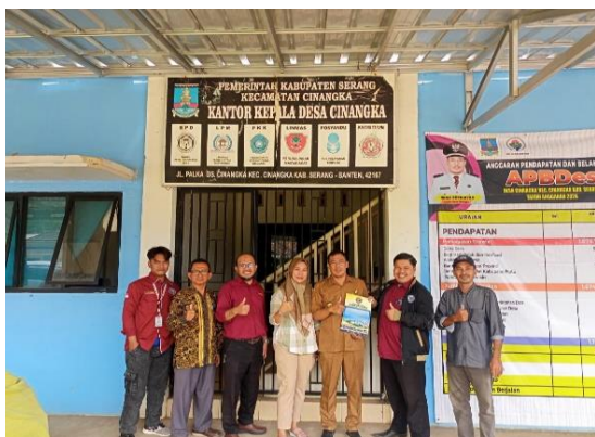
Gambar 4. Kunjungan Ke Lapangan dan Koordinasi Dengan Mitra Sasaran

tim, masyarakat setempat terutama mitra “Bina Usaha” sangat bersemangat dan apresiatif atas penyampaian motivasi oleh tim. Selain itu, Tim melakukan pengumpulan data dan identifikasi masalah pada mitra “Bina Usaha” juga masyarakat sekitar mengenai kendala yang dihadapi dalam pemasaran produk ataupun dalam pengolahan biji melinjo. Setelah identifikasi masalah terkumpul tim melaksanakan FGD dengan mitra untuk jadwal pelaksanaan PKM di Desa Cinangka. Analisa awal dan sosialisasi PKM yang dilaksanakan oleh tim berjalan dengan lancar dengan penyambutan hangat dari pejabat setempat BUMDes mitra “Bina Usaha” dan juga Bapak Lurah serta antusias dari masyarakat sekitar.