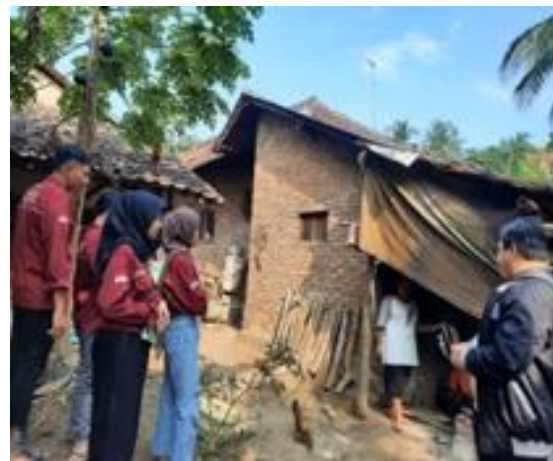
Gambar 2. Survey Awal Tim Pengabdian Ke Mitra Usaha

Berdasarkan survey awal yang dilakukan 2 kali tim pengabdian pada tanggal 1 Maret dan 12 Maret 2024, maka dapat ditemukan permasalahan dari BUMDes “Bina Usaha” yaitu berkaitan dengan pengelolaan unit usaha BUMDes itu sendiri, sehingga usahanya stagnan. Maka dari itu, perlu adanya solusi yang inovatif untuk lebih meningkatkan hasil dari pada produksi olahan melinjo yang berupa Emping dalam bentuk mentah ataupun yang telah diolah dan siap saji. Produk olahan Melinjo pada kegiatan ini adalah pelatihan dan pendampingan dalam proses pengolahan produk Melinjo sehingga menjadi produk olahan berupa emping yang telah matang ataupun yang masih mentah dengan diadakan pelatihan penggunaan mesin penumbuk biji melinjo sehingga dapat meringankan masyarakat dalam memipihkan biji melinjo tersebut. Beberapa tahapan dalam kegiatan PKM inia dalah : thap perencanaan kegiatan (survey awal dan juga izin ke pihak terkait), tahap pelaksanaan (sosialisasi, penyuluhan dan pelatihan), tahap evaluasi dan monitoring serta tindak kelanjutan hasil kegiatan.