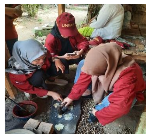
Gambar 5. Tim PKM Bersama Salah Satu Mitra “Bina Usaha”