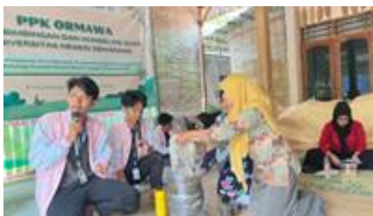
Gambar 10. Pelatihan pembuatan Kompos