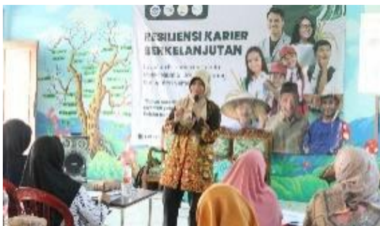
Gambar 5. Seminar Peningkatan Pendidikan

Dengan adanya pendidikan yang memadai di lingkungan masyarakat berkurangnya angka kemiskinan, tidak adanya kesenjangan sosial, tidak adanya ketidaksetaraan yang akan semakin meluas, adanya perkembangan stabilitas di berbagai sektor kehidupan. Dari hal tersebut Tim PPK Ormawa Himpunan Mahasiswa Bimbingan dan Konseling Universitas Negeri Semarang berusaha untuk dapat meningkatkan minat pendidikan terkhusus pada golongan remaja. Karena Masa remaja adalah periode penting untuk membentuk karakter dan keterampilan penting. Dengan membekali remaja dengan pendidikan yang baik, nilai-nilai positif dan keterampilan yang relevan, kita dapat memastikan bahwa mereka siap untuk menghadapi tantangan masa depan. Tim PPK Ormawa HIMA BK UNNES berkoordinasi dengan berbagai pihak, seperti Karang Taruna dan pihak Sekolah dalam mensukseskan upaya meningkatkan minat pendidikan pada golongan remaja di Desa Ketapang, Kec. Susukan, Kab. Semarang.