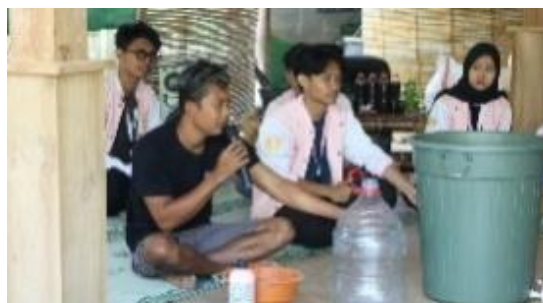
Gambar 9. Pelatihan BUDI-KDAMBER

Pada indikator keberhasilan keterampilan perempuan untuk mengelola UMKM berbasis teknologi ini berfokus pada peningkatan ekonomi dan ketahanan pangan keluarga yang mana memiliki fokus pada pemanfaatan limbah rumah tangga untuk dijadikan kompos dan budidaya lele dalam ember. Dengan adanya pemanfaatan limbah organik ini dapat diolah menjadi kompos yang berguna sebagai pupuk alami. Pupuk ini kemudian digunakan untuk mendukung pertumbuhan tanaman sayuran di rumah. Selain itu, program ini juga mendorong keluarga untuk memanfaatkan ember sebagai wadah budidaya lele, sehingga lebih ringkas secara ukuran dan dapat menghasilkan sumber protein hewani secara mandiri. Kombinasi dari budidaya lele dan penggunaan kompos tidak hanya membantu mengurangi limbah rumah tangga, tetapi juga meningkatkan ketahanan pangan dan ekonomi keluarga dengan hasil yang dapat dikonsumsi sendiri atau dijual. Dari hal ini dapat pula dapat dijadikannya atau memotivasi peserta sekolah Perempuan teras harmoni untuk dapat berkembang, berinovasi dan mensejahterakan keluarga.