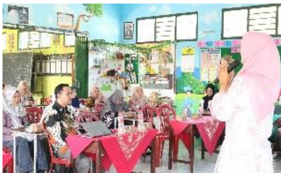
Gambar 7. Seminar Kesehatan Mental

manajemen stress ini dilaksanakan dengan upaya meningkatkan kesehatan mental bagi masyarakat di Desa Ketapang.