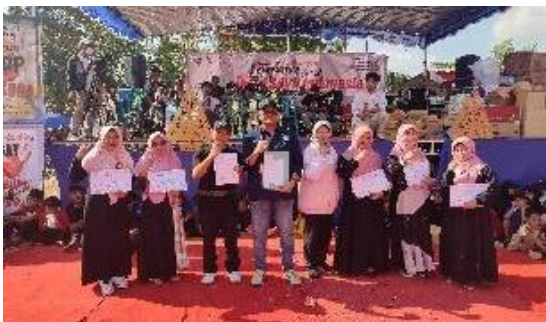
Gambar 11. Pengukuhan Kepengurusan Teras Harmoni

bidang kesiswaan, sekretaris, dan bendahara, yang bertugas memonitor dan mengelola berbagai divisi. Divisi-divisi tersebut mencakup peran perempuan, pendidikan, kesehatan mental, dan perekonomian, dengan program kerja yang dirancang untuk memberdayakan perempuan melalui seminar, pelatihan praktis, serta dukungan kesehatan mental dan pendidikan, termasuk pembentukan tim sigap harmoni tim yang khusus untuk menangani kebutuhan kesehatan mental di desa tersebut. Media sosial Sekolah Perempuan Teras Harmoni yang dikelola oleh kepengurusan baru ini didampingi oleh Tim PPK ORMAWA untuk memastikan arah dan konten yang tepat. Media sosial tersebut berfungsi sebagai platform informasi dan promosi yang efektif, dengan fokus pada penyampaian materi terkait pelaksanaan program kerja. Konten yang dibagikan mencakup informasi bermanfaat dan edukatif yang tidak hanya mendukung program-program sekolah, tetapi juga memberdayakan perempuan melalui pengetahuan yang relevan dan praktis. Dengan manajemen yang tepat, media sosial ini diharapkan dapat memperluas jangkauan dan dampak dari inisiatif sekolah di komunitas Desa Ketapang dan sekitarnya.