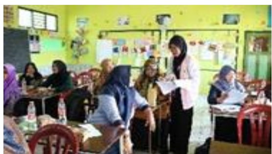
Gambar 8. Pengisian Kotak Stres oleh Peserta