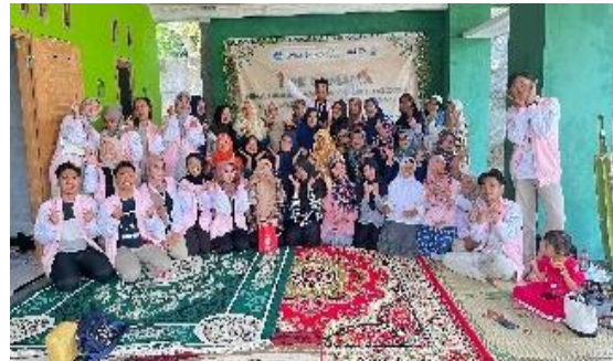
Gambar 1. Pembentukan Sekolah Perempuan Teras Harmoni

pendidikan non-formal ini telah diterapkan pada pelaksanaan program di Sekolah Perempuan. Konsep dalam pemberdayaan kepada peserta Sekolah Perempuan Teras Harmoni ini merujuk pada peningkatan kesejahteraan keluarga terpadu melalui model kesehatan mental ekologis atau dapat disebut dengan Ecological Mental Health di Desa Ketapang.