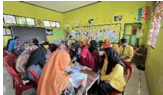
Gambar 4. Forum Grup Discussion Peran Perempuan