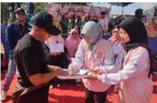
Gambar 12. Penandatanganan IA Kontrak Kerja sama