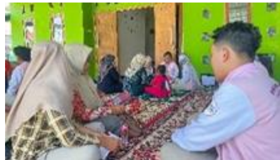
Gambar 2. Diskusi Program

2. Terlaksananya proses pembelajaran sekolah perempuan. Program pendidikan non-formal oleh Peserta atau siswa sekolah perempuan Desa Ketapang ini merupakan bentuk implementasi kurikulum pendidikan non-formal yang telah disusun oleh Tim PPK Ormawa Hima BK di dalamnya yang mana terdapat model yang terdiri dari lima sistem utama yaitu mikrosistem, mesosistem, ekosistem, makrosistem dan kronosistem, yang semuanya saling mempengaruhi dan memainkan peran penting dalam pengembangan kesejahteraan mental. Melalui program Sekolah Perempuan yang terstruktur dapat membantu perempuan mencapai kemandirian dan kesejahteraan yang mana modul pembelajaran yang kemerehensif adalah salah satu cara efektif untuk memberdayakan perempuan. Menurut (Suharto:2005) untuk mencapai tujuan pemberdayaan di perlukannya salah satu cara efektif untuk memberdayakan perempuan adalah proses menuju masyarakat yang lebih adil dan setara, yang mana perempuan memiliki kemampuan dan kepercayaan diri untuk memenuhi kebutuhan hidupnya sendiri. Perempuan yang berdaya dapat secara aktif berpartisipasi dalam kehidupan masyarakat baik