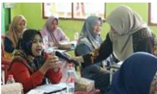
Gambar 6. Dinamika aktif peserta dan pembicara Sekolah Perempuan

5. Meningkatnya kepedulian perempuan terkait cara merawat kesehatan mental. Sebelum dilaksanakannya program, pengetahuan peserta Sekolah Perempuan. Sebanyak 30% perempuan di Desa Ketapang yang mengetahui cara merawat kesehatan mental. Model kesehatan mental ekologis atau disebut dengan Ecological Mental Health merupakan inisiatif yang dirancang untuk meningkatkan kesejahteraan keluarga melalui pendekatan terpadu. Pada program ini perangkat desa, dosen terkait dan siswa dari Sekolah Harmoni akan berpartisipasi dalam menunjukkan komitmen bersama untuk menciptakan perubahan positif di masyarakat. Program yang menjadi sorotan dirancang untuk meningkatkan kesehatan mental memperkuat peran perempuan dalam keluarga dan masyarakat dengan memberikan pengetahuan dan keterampilan yang diperlukan untuk terlibat aktif dalam berbagai bidang termasuk ekonomi, pendidikan dan kesehatan mental. Setelah dilaksanakannya upaya preventif dan penanganan gangguan kejiwaan secara psikologis, persentase perempuan yang peduli tentang cara merawat kesehatan mental meningkatkan menjadi 70%.