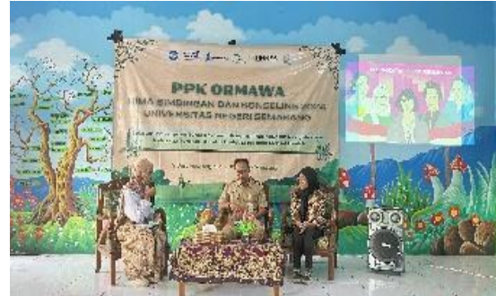
Gambar 3. Seminar Peran Perempuan

pemahaman yang kuat terhadap nilai-nilai agama dan komitmen untuk saling membimbing dan menghormati pasangan, dari bimbingan pranikah diharapkan dapat mengurangi angka perceraian dan meningkatkan keharmonisan dalam keluarga (Aini & dkk, 2024).