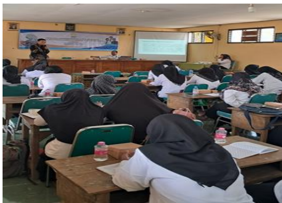
Gambar 1. Penyampaian Materi Pengabdian

Hasil kegiatan pengabdian yang telah dilaksanakan terkait penguatan interelasi guru dan kurikulum dalam upaya pengembangan lembaga PAUD yang berkualitas telah dilaksanakan dengan kegiatan yang dimulai dari diskusi tentang permasalahan yang terkait dengan guru dan kurikulum di lembaga, penyampaian materi penguatan interelasi guru dan kurikulum, dilanjutkan dengan diskusi pengembangan. Pada kegiatan pelatihan mengembangkan kurikulum PAUD, guru diminta untuk memperhatikan potensi dan penciri lembaganya. Guru dalam mengembangkan kurikulum lembaganya, diharapkan berisi program-program kegiatan yang lebih kreatif dan inovatif. Kegiatan penguatan interelasi ini, juga mengantarkan pada lembaga PAUD, menjadi lebih tanggap terhadap perkembangan dan berbagai perubahan yang terjadi. Guru harus mampu mengembangkan kurikulum sesuai kebutuhan anak dan masyarakat yang berisi program atau materi yang menarik dan prediktif untuk masa depan anak.