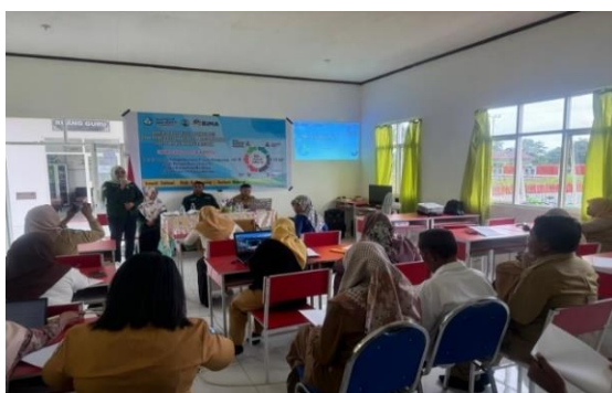
Gambar 1. Pembukaan Kegiatan Pelatihan

Kegiatan pelatihan ini dilaksanakan pada hari Selasa tanggal 10 September 2024, pukul 08.00 WIT sampai 15.00 WIT di laboratorium komputer SD Negeri Unggulan 11 Pulau Morotai. Hari pertama dihadiri oleh 20 orang guru. Kegiatan diawali dengan pembukaan oleh ketua tim pengabdian masyarakat kemudian sambutan oleh kepala sekolah sekaligus membuka kegiatan, kemudian dilanjutkan dengan penyajian materi oleh narasumber tentang profil pelajar pancasila. Materi yang disampaikan oleh narasumber meliputi: memahami P5, menyiapkan ekosistem sekolah, mendesain P5, evaluasi dan tindak lanjut, dokumentasi dan laporan.