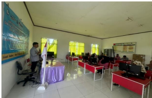
Gambar 5. Mendesain P5 dengan menentukan tema

Setelah tim P5 dibentuk di SDN Unggulan 11 Pulau Morotai, langkah selanjutnya adalah mendesain proyek berbasis kearifan lokal dipandu oleh Kepala Sekolah dan Tim Pengabdi. Penerapan profil pelajar pancasila disekolah mengacu pada tema-tema proyek yang ada pada kurikulum merdeka. Pelaksanaan proyek disesuaikan dengan keadaan sekolah SD Negeri Unggulan 11 Pulau Morotai proyek dilaksanakan pada Hari sabtu tanggal 14 September 2024 yang mana pada proyek ini mengangkat tema "Gaya Hidup Berkelanjutan". Kemudian hasil diskusi tim dengan kepala sekolah memutuskan memilih 3 tema yang akan dilaksanakan selama satu tahun. Di sekolah ini mengangkat tema Gaya Hidup Berkelanjutan, Kearifan Lokal dan Bangunlah Jiwa dan Raganya.