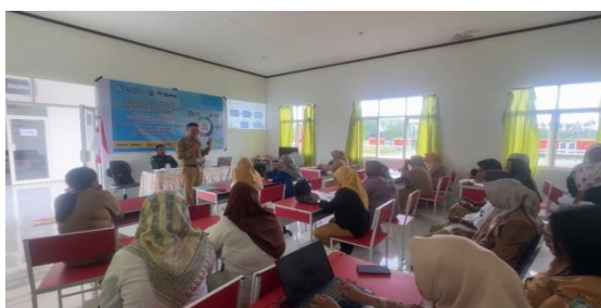
Gambar 2. Penyajian Materi oleh Narasumber

Pemaparan materi disampaikan terkait dengan pemahaman konsep dasar Merdeka belajar, Langkah-langkah projek P5, enam dimensi P5, tema-tema dalam P5 dan asesmen. Salah satu guru bertanya tentang implementasi Permendikbudristek No.12 Tahun 2024 yang menyebutkan, kurikulum pendidikan kesetaraan dilaksanakan sekurang-kurangnya melalui pemberdayaan dan keterampilan berbasis profil pelajar Pancasila. Pelaksanaan Pemberdayaan dan keterampilan dapat menggunakan pendekatan pembelajaran berbasis projek (Satria, dkk. 2024). Narasumber menjawabnya dengan menyatakan bahwa P5 dapat dilakukan bagi satuan pendidikan yang telah siap,