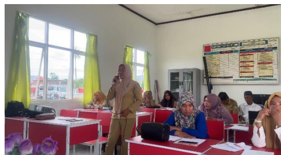
Gambar 3. Diskusi dalam Pelatihan

dan SD Unggulan 11 Pulau Morotai menjadi sasaran dalam implementasi P5. Tentunya projek dapat dilaksanakan apabila semua guru telah memahami konsep implementasi P5 sehingga akan terbiasa dan mahir dalam melaksanakan P5 di Sekolah.