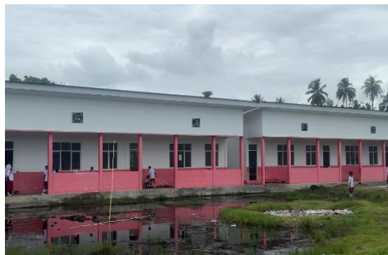
Gambar 6. Kondisi SDN Unggulan 11 Pulau Morotai

Dalam mengusung tema ini di SD N Unggulan 11 Pulau Morotai menjalankan sebuah proyek tentang penghijauan. Tema ini bertujuan untuk meningkatkan pemahaman siswa terhadap dampak dari aktivitas manusia, baik jangka pendek maupun jangka panjang, terhadap keberlangsungan kehidupan di dunia maupun lingkungan sekitarnya. Membangun kesadaran siswa untuk bersikap dan berperilaku ramah lingkungan, serta mencari solusi dari masalah lingkungan adalah fokus utama tema ini. Tema ini juga cocok dengan lingkungan sekolah yang hanya dikelilingi rumput dan tidak ada satupun pohon atau taman sehingga apabila musim kemarau terasa sangat panas, dan apabila musim hujan akan terjadinya banjir karena kurang resapan.