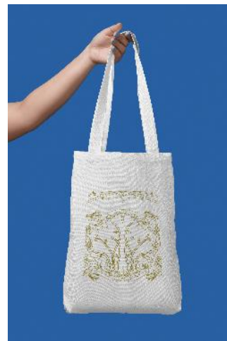
Gambar 7. Mockup Produk Batik 'Sigeupah Buloh'

Pada tahap awal, pengembangan produk batik dibuat dalam produk terapan dalam bentuk tote bag dengan variasi batik hasil pengembangan motif. Produk ini bersifat uji coba dan secara bertahap akan disempurnakan baik dalam aspek bahan, proses pengerjaan maupun kualitas kontrol lainnya.