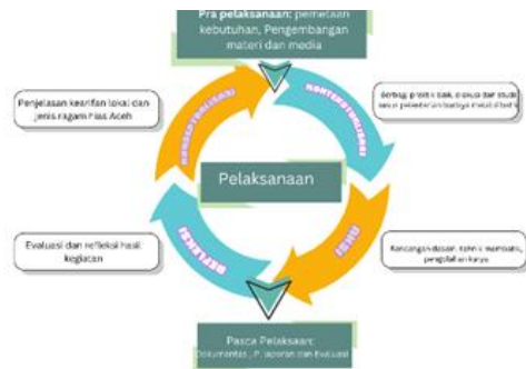
Gambar 1. Kerangka Kerja Pelaksanaan Pengabdian

Adapun kerangka kerja dalam pengabdian ini mengikuti alur sebagai berikut: