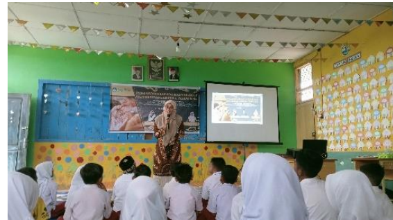
Gambar 4. Workshop Membuatik

Pada tahap workshop membuatik, kegiatan difokuskan pada praktik langsung dalam pembuatan batik dengan menggunakan bahan-bahan alami dari lingkungan sekitar. Workshop ini dirancang sebagai kesempatan bagi siswa dan guru untuk menerapkan pengetahuan yang telah diperoleh sebelumnya tentang ragam hias dan potensi pewarna alami.