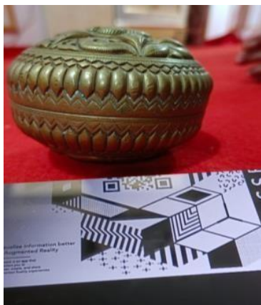
Gambar 8. Label Informasi Motif dengan Bantuan Barcode Generator

Setelah memahami konsep dasar, peserta diberikan kesempatan untuk mempraktikkan pembuatan barcode secara langsung. Mereka dilatih untuk memasukkan informasi yang relevan dan merancang barcode yang sesuai dengan kebutuhan produk batik yang telah mereka kembangkan. Selain itu, peserta juga diajarkan cara mencetak dan menempelkan barcode pada label produk atau bahan informasi lain, sehingga setiap produk memiliki identitas digital yang mudah diakses oleh konsumen.