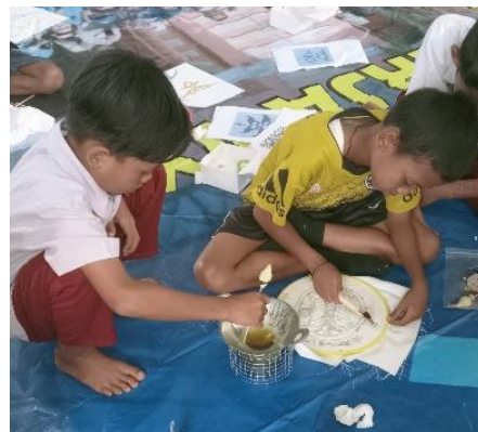
Gambar 5. Siswa Melakukan Eksperimen Membuatik

Workshop dimulai dengan sesi pengenalan alat dan bahan membuatik, di mana peserta diajak memahami langkah-langkah teknis dalam proses pembuatan batik, mulai dari mencanting, menerapkan lilin, hingga pewarnaan. Pada dasarnya fokus utama dari kegiatan ini adalah penggunaan bahan pewarna alami yang telah diidentifikasi dalam tahap sebelumnya, seperti daun, akar, kulit pohon, atau bunga yang menghasilkan warna-warna alami. Bahan alami yang dapat digunakan dan tersedia di lingkungan antara lain kulit manggis, kulit mangrove (Sri et al., 2022), kunyit, bunga telang, mengkudu dan secang.