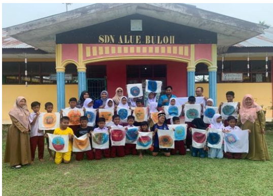
Gambar 6. Batik Karya Siswa

Hasil dari workshop diharapkan dapat memperkuat kesadaran akan pentingnya menjaga lingkungan dan memanfaatkan sumber daya alam secara berkelanjutan dalam proses kreatif. Selain itu, karya batik yang dihasilkan menjadi bentuk nyata dari kolaborasi antara pengetahuan tradisional dan eksplorasi lokal, yang dapat terus dikembangkan oleh siswa, guru, dan komunitas sekolah di masa depan.