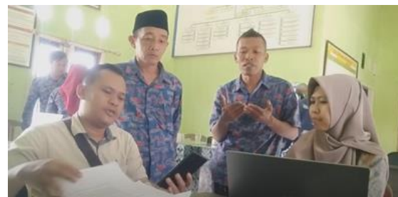
Gambar 3. Pendampingan

Selanjutnya, Tim pelaksana memberikan pendampingan yang intensif kepada pengelola BUMDes untuk memastikan mereka dapat mengoperasikan aplikasi TAKABUMDes dengan baik. Pendampingan ini bertujuan agar pengelola BUMDes memahami dengan jelas setiap fungsi aplikasi, mulai dari pencatatan transaksi harian hingga penyusunan laporan keuangan yang akurat dan berkualitas. Selain itu, tim juga memberikan konsultasi terkait pemecahan masalah yang muncul selama proses pencatatan keuangan dan pengelolaan transaksi (Lintong et al., 2020). Pendampingan dilakukan melalui dua pendekatan, yaitu online dan offline , guna memastikan aksesibilitas yang fleksibel bagi pengelola BUMDes. Pendampingan online memungkinkan pengelola untuk mendapatkan bimbingan jarak jauh kapan saja dibutuhkan, sementara sesi offline dilakukan secara langsung untuk memberikan penjelasan yang lebih mendalam dan hands-on kepada pengelola. Dengan adanya pendampingan ini, diharapkan pengelola BUMDes dapat meningkatkan kemampuan mereka dalam mengelola keuangan dan menghasilkan laporan yang lebih transparan dan akuntabel (Arista et al., 2021).