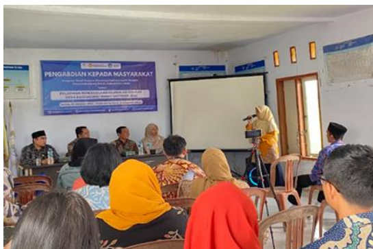
Gambar 4. Dokumentasi Pelatihan

Pelatihan mengenai pentingnya pengelolaan keuangan BUMDes yang sesuai dengan prinsip dasar pengelolaan keuangan yang berlaku telah memberikan dampak yang signifikan dalam meningkatkan keterampilan dan kemampuan pengelola BUMDes. Peningkatan tersebut terlihat jelas baik dari segi pembuatan laporan keuangan yang lebih transparan dan akuntabel, maupun dalam hal pengelolaan penggunaan dana serta alokasi biaya operasional yang lebih efisien. Dengan diterapkannya prinsip-prinsip tersebut, pengelola BUMDes dapat membuat keputusan yang lebih tepat dalam hal pengelolaan sumber daya, serta meminimalkan potensi penyalahgunaan dana. Dampak positif dari pelatihan ini diharapkan dapat memperkuat stabilitas keuangan BUMDes dan memberikan fondasi yang kokoh untuk pengembangan usaha BUMDes di masa depan, sehingga dapat lebih berkelanjutan dan memberikan manfaat yang lebih besar bagi masyarakat desa (Situmorang, 2020).