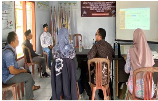
Gambar 1. Pengenalan Aplikasi TAKABUMDes

sekunder berupa laporan keuangan, dokumen transaksi, serta rekaman kegiatan yang telah dilaksanakan oleh BUMDes. Metode-metode ini digunakan secara komprehensif untuk memperoleh data yang valid dan mendalam, yang akan digunakan sebagai dasar dalam analisis dan evaluasi program yang dilaksanakan (Sari et al, 2023).