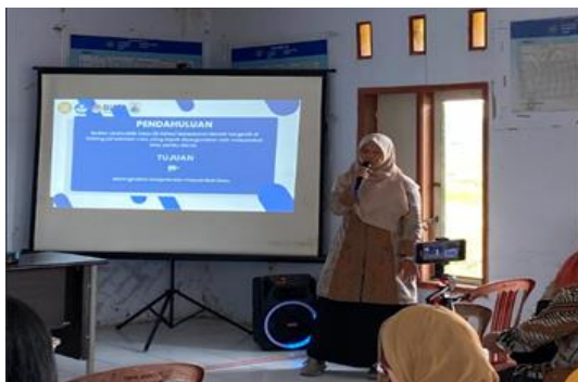
Gambar 2. Pelatihan

Tim pelaksana kemudian melakukan evaluasi terhadap Standar Operasional Prosedur (SOP) yang selama ini tidak tertulis dan telah diterapkan oleh Pengelola BUMDes. Evaluasi ini dilakukan untuk mengidentifikasi kekurangan dalam prosedur operasional yang ada, dengan tujuan untuk memperbaiki dan menyusun SOP yang lebih terstruktur dan terdokumentasi dengan baik. Perbaikan SOP ini sangat penting agar BUMDes dapat memiliki sistem pengelolaan yang lebih efisien, serta memastikan bahwa laporan keuangan dan operasional yang disusun memenuhi asas transparansi dan akuntabilitas sesuai dengan Standar Akuntansi Keuangan yang berlaku di Indonesia (Bawono et al, 2023). Dengan adanya SOP yang jelas dan tertulis, BUMDes diharapkan dapat meningkatkan kualitas pengelolaan dan memberikan informasi yang dapat dipertanggungjawabkan kepada seluruh stakeholder BUMDes, termasuk masyarakat desa, pemerintah, dan pihak terkait lainnya (Marpaung dan Averio, 2023). Penyusunan SOP yang lebih baik ini juga akan memberikan pedoman yang lebih jelas dalam setiap proses pengelolaan BUMDes, sehingga dapat mengurangi potensi kesalahan dan meningkatkan kepercayaan terhadap pengelolaan dana dan kegiatan yang dilakukan.