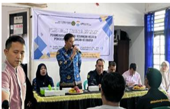
Gambar 4. Sambutan oleh Sekcam Kertapati dan Dekan FEB UM Palembang

Gambar di atas merupakan kegiatan yang berlangsung dan pengarahannya serta sambutan yang diberikan oleh pemerintah setempat dan pimpinan perguruan tinggi, sebagai bentuk dukungan penuh atas diselenggarakannya kegiatan pengabdian kepada masyarakat ini.