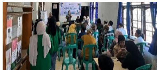
Gambar 5. Penyampaian Pembekalan Oleh Tim Dosen FEB UMPalembang

Gambar di atas penyampaian pembekalan materi yang disampaikan oleh tim dosen kepada masyarakat kelurahan kertapati guna memberikan wawasan yang lebih detail bahwa peranan smart people mampu menjadi potensi yang baik untuk mendukung perekonomian keluarga, serta pentingnya membuat pembukuan dan pengelollan keuangan yang tepat dalam pelaksanaan yang dilakukan.