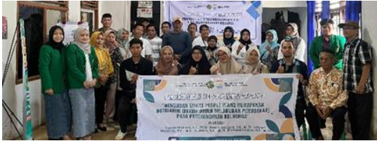
Gambar 7. Hasil yang Diperoleh

Gambar di atas merupakan proses penutupan atas kegiatan yang dilaksanakan dengan memperoleh hasil yang positif dari terselenggaranya kegiatan ini, dimana dilihat dari respon sikap yang diberikan oleh masyarakat ketika sedang dan di akhir kegiatan menunjukkan semangat dan motivasi yang penuh atas pentingnya peran smart people bagi menungjung perekonomian keluarga.