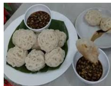
Gambar 1. Hasil Produksi Olahan Makanan dari Ikan di Kel/Kec. Kertapati

Gambar diatas aktivitas yang dilakukan sebagian besar masyarakat pelaku usaha kecil menengah (UMKM) pada pengelolaan pempek dan kerupuk yang berbahan baku dari ikan yang berasal dari sungai Musi yang jarak antara pemukiman warga dan sungai sangat berdekatan. Penjualan hasil pengelolaan ini biasanya di jual dalam kota dan juga seluruh luar kota, meskipun masih dalam skala yang masih kecil.