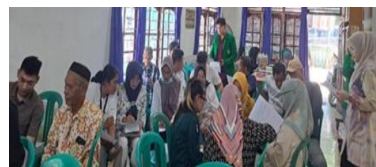
Gambar 6. Proses Diskusi pada Masyarakat Kelurahan Kertapati

Gambar di atas merupakan pelaksanaan diskusi yang dilakukan antara pemateri dan masyarakat setempat, diskusi ini bertujuan untuk menggali dengan pasti atas hambatan ataupun permasalahan yang perlu di kaji ulang guna pengambilan keputusan yang lebih tepat.