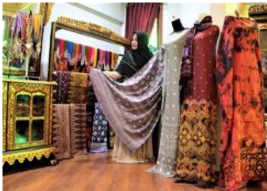
Gambar 2. Hasil Produksi Jumputan di Kelurahan/Kecamatan Kertapati

Gambar di atas merupakan kegiatan masyarakat kelurahan kertapati yang melakukan penelolan pada industry tekstil yaitu jumputan yang dari proses pembuatan kain, pewarnaan hingga menjadi bahan jadi atapun baju dilakukan dengan cara tradisional dan masih berkelompok.