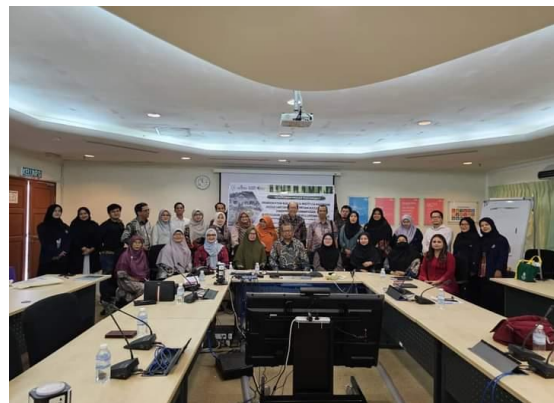
Gambar 2. Pemaparan Profil Jurusan IESP FEB UNTAN