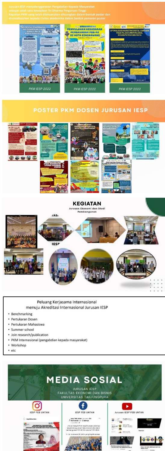
Gambar 4. Materi Kegiatan