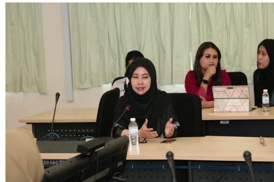
Gambar 1. Pemaparan Profil FEB UNIMAS