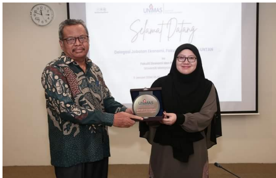
Gambar 3. Dokumentasi Kegiatan