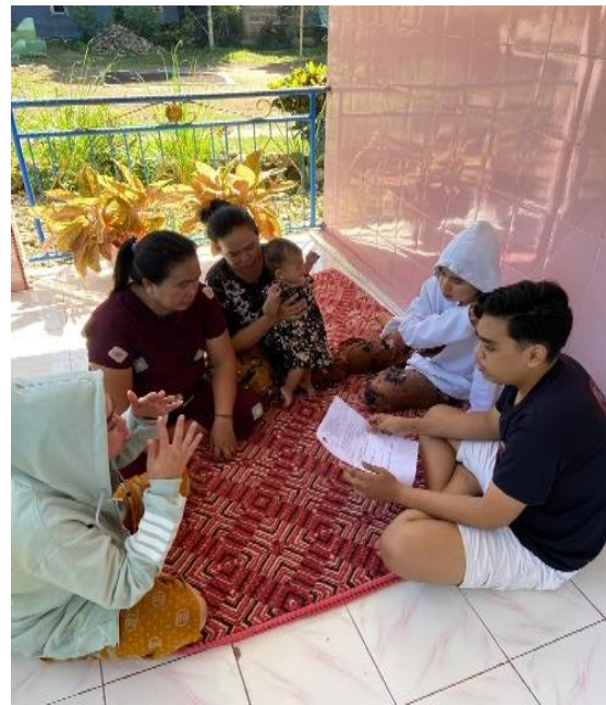
Gambar 2. Wawancara dan Survei terhadap Responden

Dari hasil wawancara dan survei yang dilakukan terhadap 50 responden, teridentifikasi beberapa kebutuhan utama pengguna terkait website yang sedang dikembangkan. Sebagian besar responden menginginkan kemudahan akses informasi, fitur interaktif, dan dukungan layanan pelanggan yang responsif. 75% responden juga menyatakan preferensinya terhadap platform yang mobile-friendly , yang memungkinkan akses yang lebih mudah dan nyaman melalui perangkat seluler. Selain itu, wawancara mengungkapkan kebutuhan mendalam terkait konten yang relevan dan terkini, yang menunjukkan pentingnya pembaruan informasi secara rutin di website.