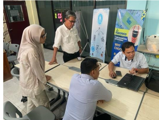
Gambar 3. Proses Pengembangan Website

Setelah desain website disetujui, langkah selanjutnya adalah pengembangan website menggunakan berbagai teknologi dan platform yang tepat untuk memastikan website berfungsi dengan optimal. Pengembangan ini melibatkan penggunaan bahasa pemrograman seperti HTML, CSS, PHP, dan JavaScript, yang memungkinkan pembuatan struktur, gaya, dan interaktivitas pada website. Selain itu, sistem manajemen konten (CMS) seperti WordPress atau Joomla juga digunakan untuk memudahkan proses pengelolaan konten, terutama untuk mempermudah tim dalam memperbarui informasi atau artikel terkait literasi keuangan di masa depan. Dengan menggunakan CMS, pengelola website dapat dengan mudah menambah, mengedit, dan menghapus konten tanpa perlu keterampilan teknis yang mendalam.