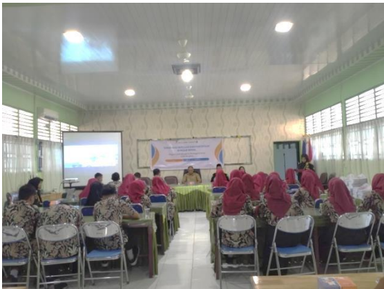
Gambar 1. Penyampaian Materi Sosialisasi dan Edukasi

Tim Program Studi Manajemen Keuangan Syariah dan SMA Negeri 2 Bengkulu bekerja sama untuk melaksanakan program sosialisasi dan edukasi investasi dan portofolio pasar modal ini. Pengabdian ini dilakukan pada tanggal 14 Mei 2024 di SMA Negeri 2 Bengkulu dan ditujukan untuk siswa SMA Negeri 2 Bengkulu. Tujuan dari kegiatan sosialisasi dan edukasi ini, yang merupakan bentuk pengabdian kepada masyarakat, adalah untuk memberi generasi milenial wawasan dan literasi keuangan di bidang investasi dan portofolio pasar modal sejak dini. Peserta diajarkan tentang pasar modal dan pentingnya investasi sejak dini dan manfaat berinvestasi di pasar modal.