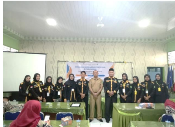
Gambar 3. Foto Bersama

Selain dari hasil secara keilmuan dan edukasi, kegiatan ini juga mendapatkan hasil secara sosial yaitu mendapat respon yang positif dari pihak sekolah, bahwa pihak sekolah merasa senang dan berterima kasih atas kepercayaan untuk menjadikan sekolahnya menjadi tempat untuk sosialisasi dan edukasi yang memberikan ilmu yang bermanfaat bagi para siswa. Hal ini dapat dilihat pada foto bersama di bawah ini.