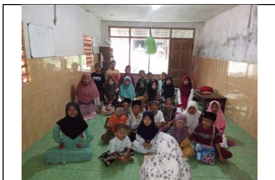
Gambar 1. Santriwan Santriwati TPQ Nurul Huda

Salah satu wilayah yang terdampak adalah Desa Mayong, Kecamatan Karangbinangun, Kabupaten Lamongan. Mitra dalam kegiatan pengabdian ini adalah Bapak Nur Kholil, pemilik sekaligus pengasuh TPQ Nurul Huda. Di lingkungan TPQ tersebut, air yang digunakan untuk kebutuhan mandi dan berwudhu bersumber dari telaga atau waduk yang kualitasnya sangat rendah. Air yang tersedia tidak hanya keruh, tetapi juga berbau, berlumut, dan terasa tidak layak untuk digunakan.