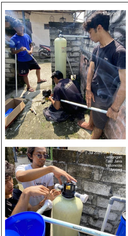
Gambar 5. Pemasangan Filter Air di Lokasi Mitra

Setelah desain alat disiapkan, dilanjutkan dengan pemasangan filter air di area tandon utama TPQ. Proses pemasangan mencakup pengaturan posisi alat, penyambungan dengan sistem distribusi air yang ada, serta penyesuaian teknis sesuai kondisi lapangan.