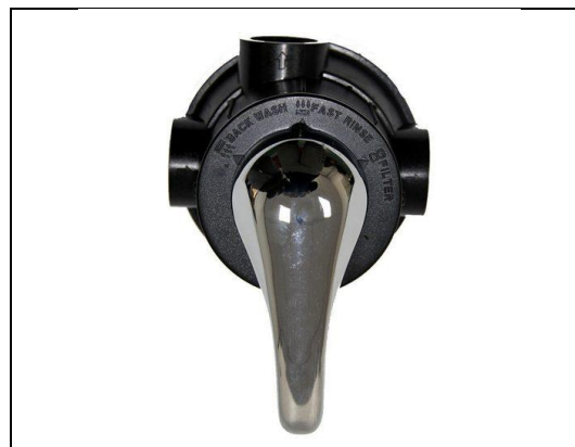
Gambar 6. Valve 3 Selektor Filter Air

Setelah alat terpasang dengan baik, dilaksanakan sesi pelatihan untuk perwakilan masyarakat atau operator lokal. Pelatihan ini mencakup prosedur pengoperasian filter, termasuk pemahaman tentang tiga mode utama pada valve (kran) selektor, yaitu Backwash , Fast Rinse , dan Filter .