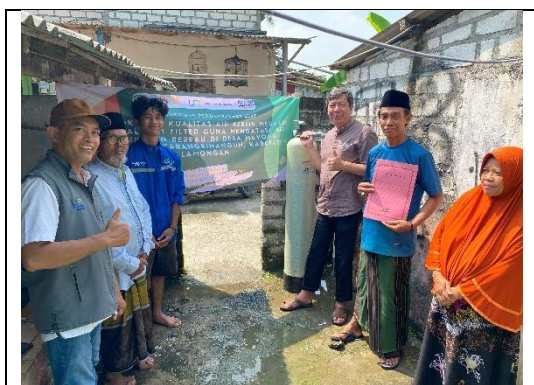
Gambar 7. Foto Bersama Pengasuh TPQ Nurul Huda

pemantauan secara berkala terhadap kualitas air dan efektivitas proses penyaringan. Evaluasi dilakukan berdasarkan pengamatan lapangan serta umpan balik dari masyarakat. Dalam kegiatan ini, peran serta masyarakat mitra sangat aktif, terlihat dari masukan dan saran yang bersifat konstruktif untuk perbaikan teknis dan proses pelaksanaan di lapangan. Beberapa permasalahan dalam pengolahan air sumur yang muncul selama kegiatan juga didiskusikan bersama dan dicarikan solusinya secara partisipatif. Pada saat yang sama, tim pelaksana bersama masyarakat mitra melakukan monitoring terhadap kualitas air hasil filtrasi menggunakan media filter yang telah dipasang dan diperagakan, untuk memastikan hasil akhir sesuai dengan standar yang diharapkan.