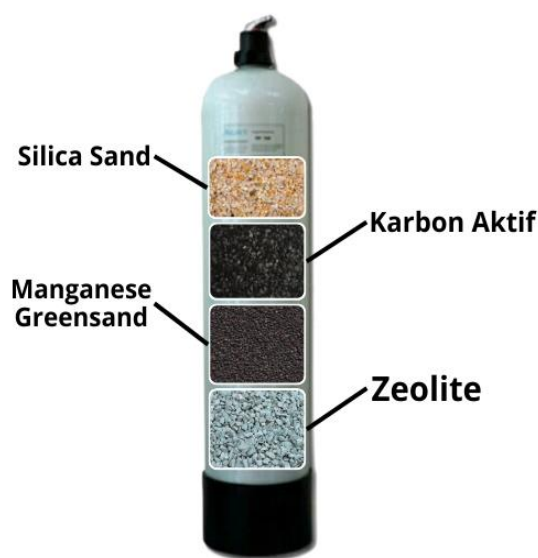
Gambar 4. Susunan Media Filter

Untuk menjawab semua permasalahan kualitas air seperti yang dijelaskan sebelumnya, digunakanlah teknologi tepat guna berupa sistem filter air yang dirancang untuk menyaring kotoran, bau, serta zat pencemar lain dari air baku. Adapun cara kerja alat pengolahan air bersih ini terdiri atas dua tahap utama. Tahap pertama yakni proses oksidasi ion besi ( Fe^{2+} ) oleh oksigen yang terlarut dalam air. Proses ini menghasilkan koloid yang mudah mengendap di dasar bak penampungan, sehingga partikel-partikel logam berat mulai terpisah dari air (Yusniartanti, 2023).