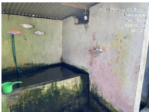
Gambar 3. Bak Penampungan Air TPQ Nurul Huda

Observasi dilakukan untuk memperoleh data awal mengenai kondisi air yang digunakan oleh TPQ Nurul Huda. Hasil pengamatan menunjukkan bahwa air sumur yang menjadi sumber utama kebutuhan sehari-hari masyarakat cenderung keruh, berbau, dan berwarna. Air tersebut menimbulkan ketidaknyamanan dalam aktivitas rumah tangga maupun ibadah. Data yang dikumpulkan meliputi kondisi fisik air, sumber distribusi air, serta keluhan masyarakat yang selama ini dihadapi (Nindiasari, 2024).