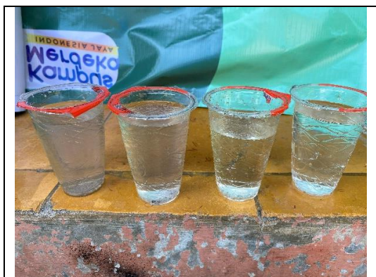
Gambar 8. Perbandingan Air Sebelum dan Sesudah Difilter

Berdasarkan hasil yang ditunjukkan pada Gambar 8, terlihat adanya perbedaan signifikan antara kondisi air sumur masyarakat mitra sebelum dan sesudah dilaksanakannya pengabdian. Sebelum dilakukan pengolahan, air sumur umumnya tidak layak digunakan sebagai sumber air minum maupun kebutuhan rumah tangga. Secara fisik, air tampak berwarna, keruh, berbau, dan berlumut. Padahal, air bersih yang memenuhi syarat kesehatan harus bebas dari pencemaran dan memenuhi standar fisik, kimia, serta biologis, karena air yang tidak memenuhi standar kualitas dapat menimbulkan gangguan kesehatan (Djana, 2023).