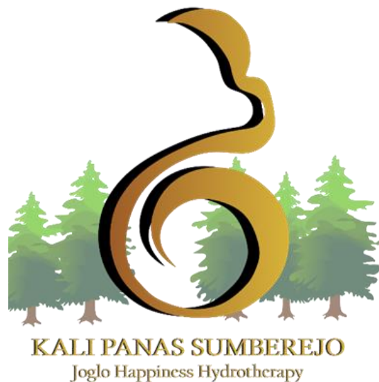
Gambar 5. Konsep Logo Wisata