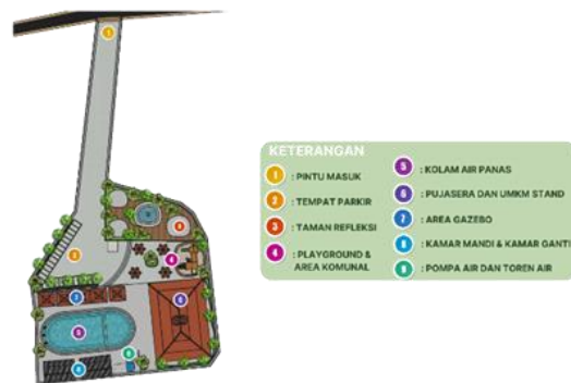
Gambar 4. Konsep Rancangan Tapak dan Fasilitas Wisata