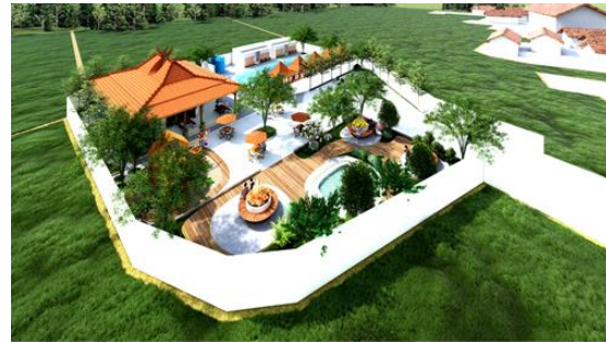
Gambar 3. Desain Konseptual Wisata Kali Panas Sumberjo