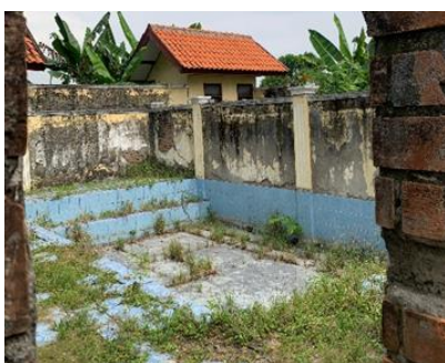
Gambar 2. Foto Kali Panas Sumberjo

Integrasi ini kemudian dikunci dan dikomunikasikan melalui strategi Branding Partisipatif . Tagline " Joglo Happiness Hydrotherapy " bukanlah slogan yang dibuat secara acak, melainkan merupakan kristalisasi dari kedua konsep sebelumnya. Kata ' Joglo ' merepresentasikan identitas arsitektur ( Neo-Vernakular ), ' Hydrotherapy ' mengkomunikasikan fungsi utama destinasi ( Wellness Tourism ), dan ' Happiness ' menangkap tujuan emosional yang diharapkan pengunjung sekaligus aspirasi komunitas. Dengan demikian, branding ini menjadi jembatan strategis yang menghubungkan produk (desain fisik dan konsep) dengan persepsi pasar serta menumbuhkan rasa kepemilikan masyarakat, yang merupakan kunci keberlanjutan.