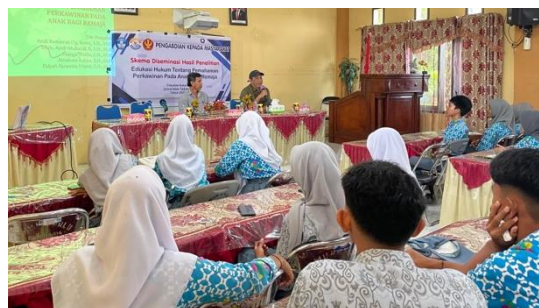
Gambar 1. Dokumentasi kegiatan pengabdian pada masyarakat pada Kamis, 21 Agustus 2025 di SMA Negeri 4 Palu.

Kegiatan pengabdian masyarakat ini telah dilaksanakan di SMA Negeri 4 Palu dengan melibatkan siswa-siswi yang tergabung dalam OSIS. Pelibatan OSIS dalam kegiatan ini dinilai sangat tepat, yang merupakan representasi siswa yang memiliki peran strategis dalam menyampaikan informasi serta menjadi teladan bagi teman-temannya di lingkungan sekolah. Pelaksanaan kegiatan berjalan dengan lancar, ditandai dengan antusiasme peserta yang tinggi sepanjang proses penyuluhan. Hal ini terlihat dari keterlibatan aktif mereka dalam sesi diskusi, tanya jawab, serta respon positif terhadap materi yang dipaparkan. Peserta menunjukkan rasa ingin tahu yang besar terutama ketika membahas batas usia anak dan usia minimal perkawinan yang diatur dalam undang-undang. Banyak peserta yang mengakui bahwa mereka baru mengetahui secara jelas ketentuan hukum mengenai usia perkawinan serta dasar hukumnya.