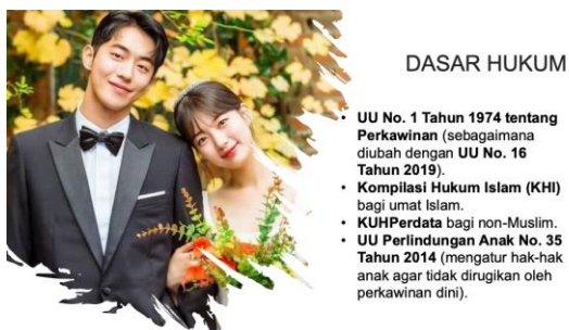
Gambar 2. Salah satu slide pemaparan tim pengabdian kegiatan pengabdian pada masyarakat pada Kamis, 21 Agustus 2025 di SMA Negeri 4 Palu.

Selain itu, peserta juga mendapatkan pemahaman baru mengenai risiko-risiko pernikahan dini, baik dari sisi kesehatan, pendidikan, sosial, maupun hukum. Diskusi menjadi semakin hidup ketika peserta mencoba mengaitkan materi dengan fenomena nyata di lingkungan sekitar mereka, di mana praktik pernikahan anak masih kerap terjadi. Pemaparan mengenai dampak negatif pernikahan dini, seperti putus sekolah, risiko kesehatan reproduksi, hingga kerentanan terhadap kekerasan dalam rumah tangga, membuka wawasan peserta bahwa perkawinan bukan sekadar urusan pribadi, melainkan keputusan besar yang memiliki konsekuensi panjang.