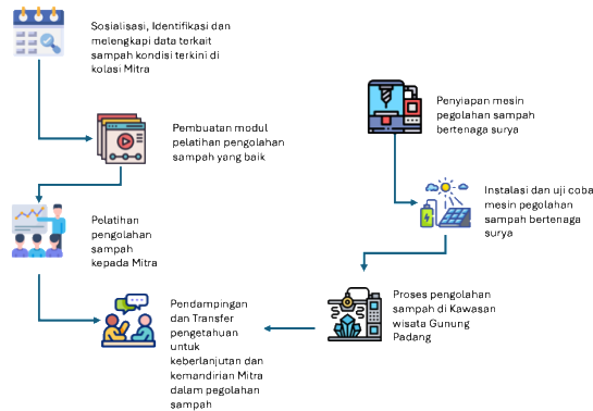
Gambar 3. Tahapan Pelaksanaan Kegiatan

Secara garis besar tahapan kegiatan yang dilakukan adalah seperti pada gambar 3 berikut ini.