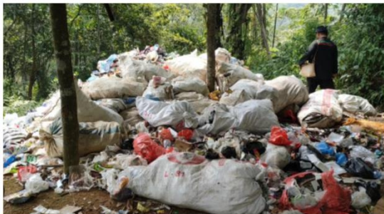
Gambar 2. Tumpukan Sampah di Kawasan Wisata Gunung Padang Cianjur Jawa Barat.

Sampah yang dibakar dapat menimbulkan polusi udara yang sangat berbahaya karena menghasilkan zat dioksin dan furan yang berpotensi menyebabkan Gangguan pernapasan (asma, bronchitis, Kerusakan sistem saraf, gangguan sistem hormon, hingga peningkatan risiko kanker.