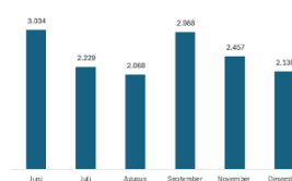
Gambar 1. Perkembangan Pengunjung Wisata Gunung Padang Juni-Desember 2024

penjualan produk lokal (gula semut, madu, kolang-kaling, dan souvenir) serta berkembangnya usaha homestay masyarakat.