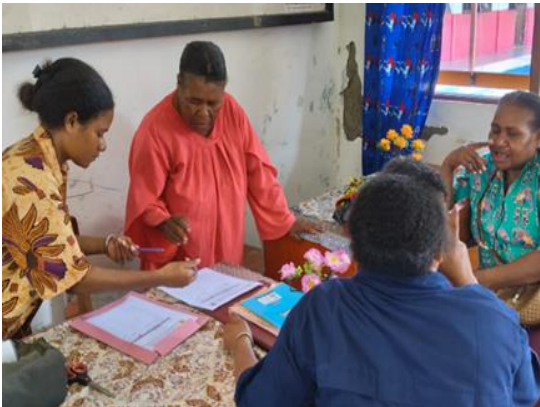
Gambar 2. Diskusi kelompok guru