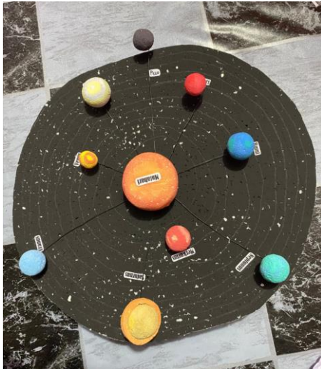
Gambar 5. Kit Alat Peraga Daur Ulang Tata Surya