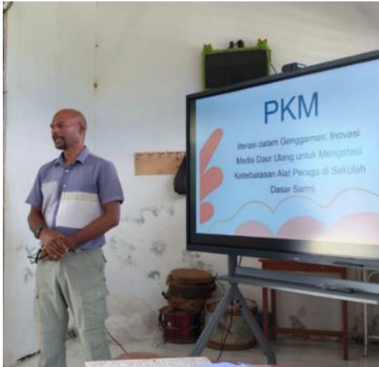
Gambar 1. Workshop Literasi Sains Pembuatan alat peraga dari daur ulang