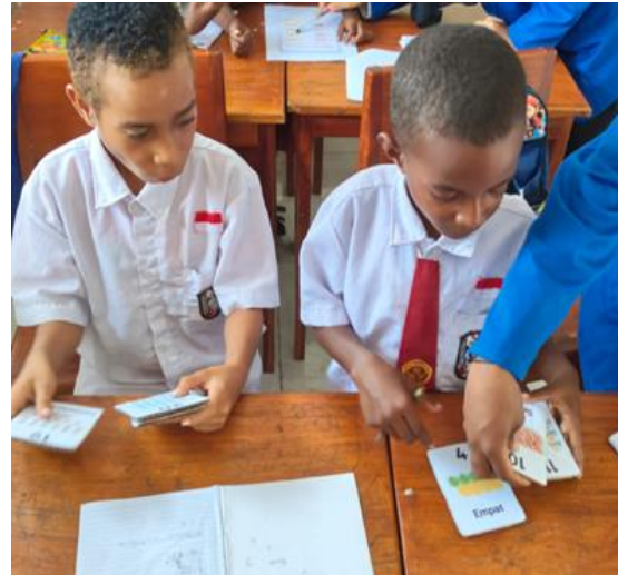
Gambar 3. Kartu bergambar