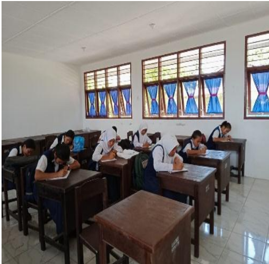
Gambar 9. Peserta Didik Sedang Mengerjakan Soal Evaluasi

Pemahaman belajar adalah kemampuan seseorang untuk mengerti atau memahami sesuatu dan setelah itu diketahui dan diingat. Pemahaman juga merupakan salah satu bentuk hasil belajar. Menurut (Sardiman, 2014:43) yaitu menguasai sesuatu dengan pikiran. Karena itu belajar berarti harus mengerti secara mental makna dan filosofinya. Pemahaman sangat penting bagi siswa yang belajar artinya pemahaman tidak hanya sekedar tau tetapi juga menghendaki agar subjek belajar dapat memanfaatkan bahan – bahan yang dipahami.