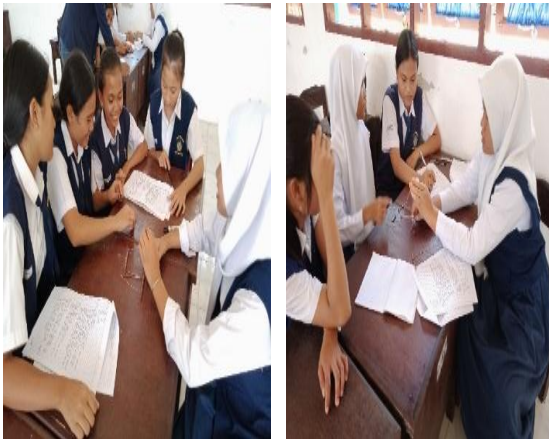
Gambar 6. Membagikan LKPD