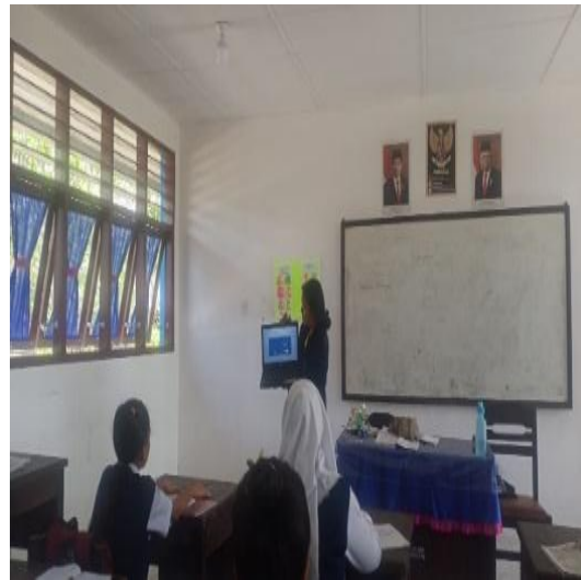
Gambar 4. Penyampaian Materi Pembelajaran

Dalam hal ini siswa berpartisipasi dengan baik dan mengikuti bimbingan belajar dengan baik. Disini peneliti hanya menyampaikan materi tentang cara membuat magnet serta aplikasi dalam kehidupan sehari hari.