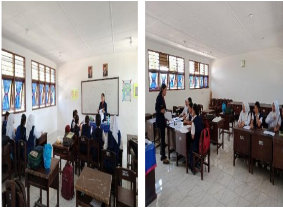
Gambar 5. Mencoba Memberikan Apersepsi Sebelum Melakukan Percobaan