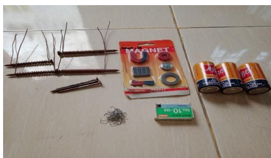
Gambar 1. Alat Dan Bahan Eksperimen

Dalam hal ini penerapan bimbingan belajar melalui alat peraga yang telah disediakan oleh guru untuk membantu pemahaman belajar siswa yang dilakukan melalui metode eksperimen oleh siswa dan guru sebagai pembimbing atau sebagai fasilitator. Adapun gambar alat dan bahan yang digunakan dalam cara membuat magnet sebagai berikut: