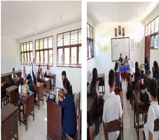
Gambar 3. Perkenalan Siswa Sesi 1 Perkenalan Siswa Sesi 2