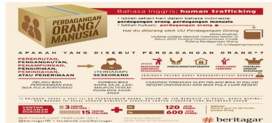
Gambar 1. Skema perdagangan orang

Ruang lingkup pada perdagangan orang selain memperdagangkan manusia juga seperti penjeratan utang, memberi bayaran/manfaat dan eksploitasi seperti eksploitasi seksual, kerja paksa/pelayanan paksa dan transplansi organ tubuh.