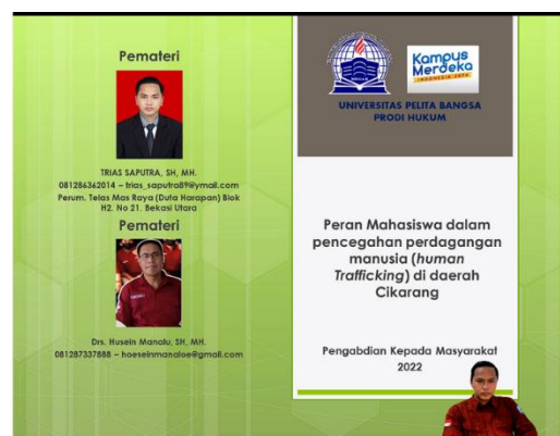
Gambar 2. Paparan materi

Setelah pemaparan materi-materi, dibuka sesi tanya jawab yang direspon sangat bagi oleh peserta dengan memberikan tanggapan dan pertanyaan seputar peristiwa-pristiwa yang terjadi di lingkungan sekitar yang patut diduga merupakan perbuatan tindak pidana perdagangan orang. Diskusi menjadi hidup dan para peserta dapat memahami dari apa yang muncul dari diskusi-diskusi tersebut.